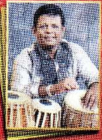
தாலதராங்கம் விஷ்ணுரத் ஸ்ரீ ரட்லம் ரட்லதுரை