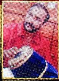
மிருதாங்கம் சாமஸ் தேசமான்ய 'கலாசரஸ்வதி' திருமலை சின்னராசா காண்டம்பன்