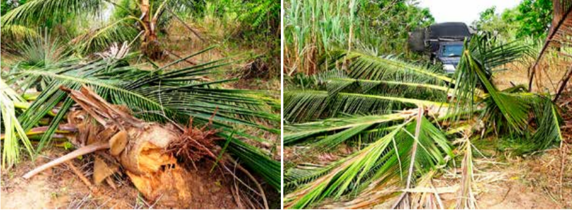
மட்டக்களப்பு, ஓக. 02

மட்டக்களப்பு வவுணதீவு பிரதேச செயலக பிரிவில் அண்மைக் காலமாக உப உணவு மற்றும் தென்னை பயிர்ச்செய்கையாளர்கள் காட்டு யானைகள் தொல்லையினால் பெரும் பாதிப்புக்குள்ளாகியிருப்பதாக தெரிவிக்கப்பட்டுள்ளது.