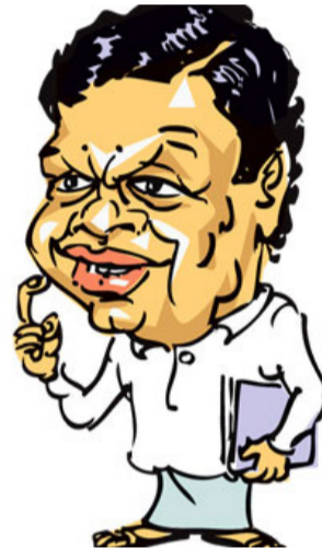
அறிவிக்கும். அதுவரை அனைவரும் பொறுமையாக இருக்க வேண்டும்-என்றார். (அ)

வீழ்ச்சியடைந்த எமது நாட்டை மீட்டெடுத்து வரும் ஒரு தலைவராக அவர் விளங்குகின்றார். இந்தநிலையில் ஜனாதிபதித் தேர்தல் அறிவிப்பு வந்தவுடன் யார் வேட்பாளர் என்பதை சிறீ லங்கா பொதுஜன பெரமுன