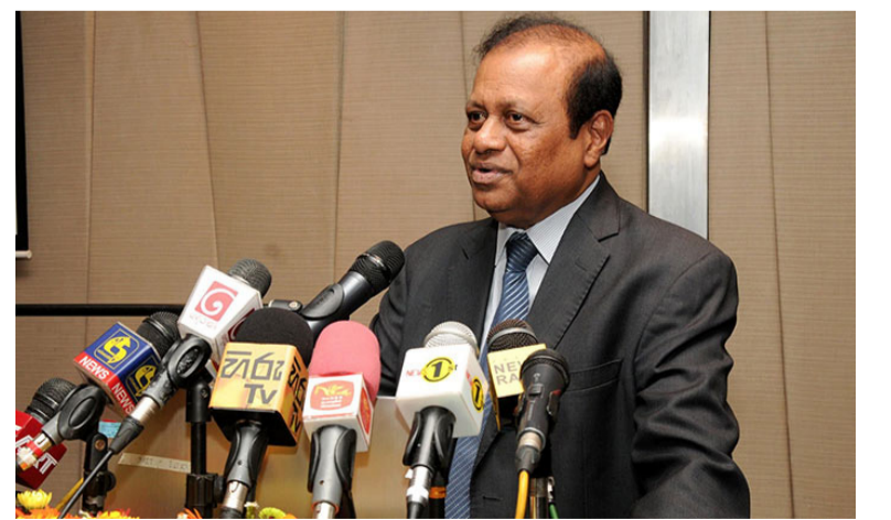
வழங்குவதற்கு ஏற்பாடு செய்யப்பட்டுள்ளதாக கல்வி அமைச்சின் தகவல்கள் தெரிவித்திருப்பி

களாக உள்வாங்கப்பட்டவர்கள் இன்னும் ஆசிரியர் சேவைக்குள் இணைத்து கொள்ளப்படாதுள்ளதாக கவலை தெரிவித்துள்ளனர். 2015ஆம் ஆண்டு மே மாதம் 19ஆம் திகதி அவர்கள், ஆசிரிய உதவியாளர்களாக இணைத்து கொள்ளப்பட்டிருந்தனர். அவர்கள், தமது பயிற்சியினை உரிய வகையில் பூர்த்தி செய்திருந்தும், இன்னும் ஆசிரிய சேவைக்குள் உள்வாங்கப்படாதுள்ளனர். கடந்த மாதத்திற்குள் மத்திய மாகாணத்தில், உள்ள ஆசிரிய உதவியாளர்களுக்கு நியமனம்