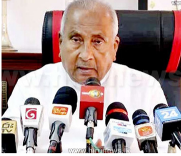
திருத்தத்துக்கு இலங்கையின் தென் மாகாணத்தில் கடும்தீர்ப்பு காணப்படும் பின்னணியில் அதை நடைமுறைப்படுத்து

நாட்டில் தமிழர்களுக்கு மாத்திரமல்ல ஒட்டுமொத்த மக்களுக்கும் பிரச்சனை உள்ளது. ஒரு தரப்பினரது பிரச்சனைக்கு அரசியலமைப்பு ஊடாக மாத்திரம் எவ்வாறு தீர்வு காண்பது? அரசியலமைப்பின் 13 ஆவது