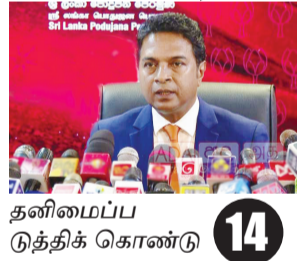
தனிமைப்படுத்திக் கொண்டு 14

கொழும்பு, ஓக. 03 “கோட்டாபய ராஜ பக்ஷவை நாங்கள் தனி மைப்படுத்தவில்லை. ராஜபக்ஷக்களிடமிருந்து விலகி தனித்து செயல்படுவதாக காண்பிப்பதற்காக அவர் தன்னைச் சய