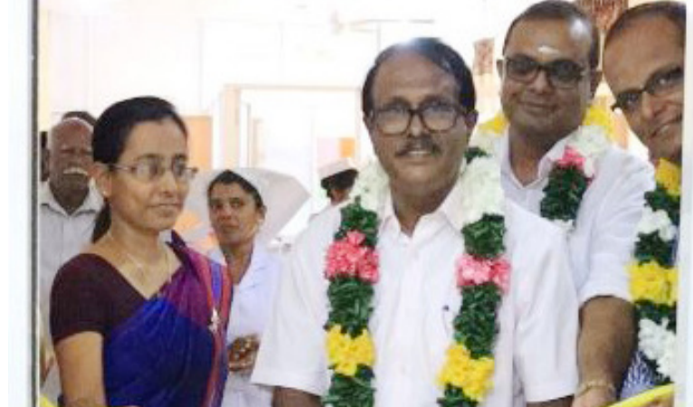
யொரு ஆதார வைத்தியசாலையாக காணப்படுகின்றமை குறிப்பிடத்தக்கது

மல்லாவி வைத்திய சாலை வன்னி பிராந்தியத்திலேயே அதிகஸ்ட பிரதேசங்களான மல்லாவி,நட்டாங்கண்டல், ஐயங்கன்குளம், கோட்டை கட்டியகுளம் போன்ற கிராமங்கள் உள்ளடங்கலான 47ஈற்கு மேற்பட்ட கிராமங்களுக்கான ஒரே