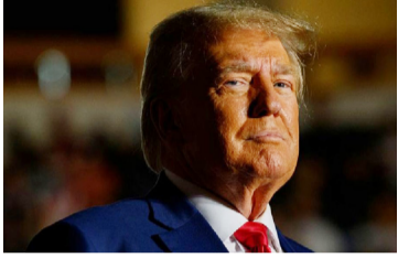
விசாரணைகளை உள்ளடக்கியுள்ளது. மீளவும் ஜனாதிபதித் தேர்த

இந்த குற்றப்பத்திரிகையானது 2021 ஜனவரியில் மேற்கொள்ளப்பட்ட கப்பிட்டல் கலவரம் சார்ந்த விடயங்களின்