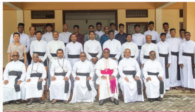
புனித சசுவரியார் குருத்துவக் கல்வாரி