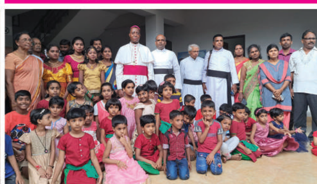
திருமறைக்கலாயன்றக் கலைத்தூறு ஐயியக்கூயம்