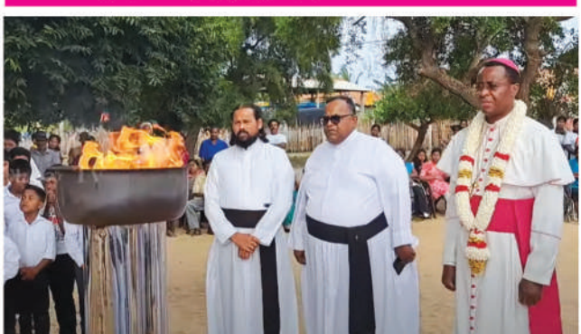
புள்ளிவாய்க்காவில் இறந்தோர்க்கான அஞ்சலி