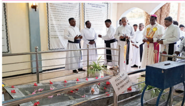
தவத்தித டதாயன் அடிக்களாரின் கல்வாரியில்