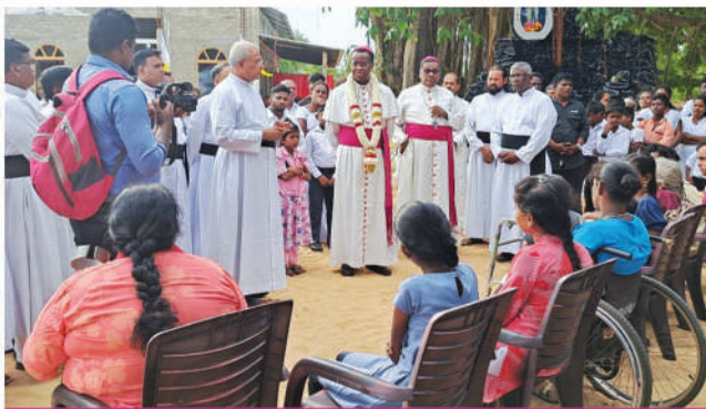
ஐயரினாஸ் பாதிக்கப்பட்ட யக்களுடன்