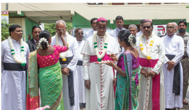
புனித பத்திரிசியார் கல்வாரி