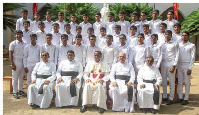
புனித மந்தீனார் குருமம்