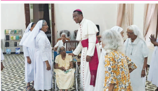
ஐம்புரிவலை அபுத்சுகாதரிகளுடன் - இளவாவை