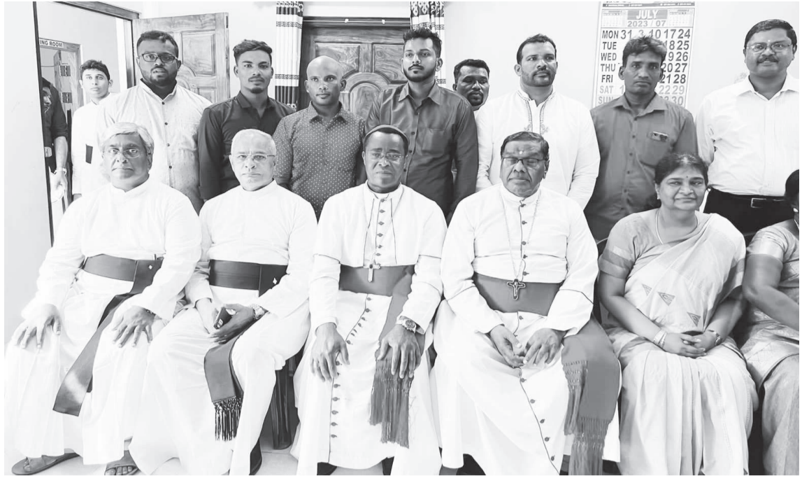
குருநகர் ஆலய அருட்பணிச் சபையினருடன் திருத்தந்தையின் இலங்கைக்கான பிரதிநிதி பேராயர் பிறாயன் உடக்கே ஆண்டகையும், யாழ் ஆயர் மற்றும் குருமுதல்வர் ஆகியோரைப் படத்தில் காணலாம்.