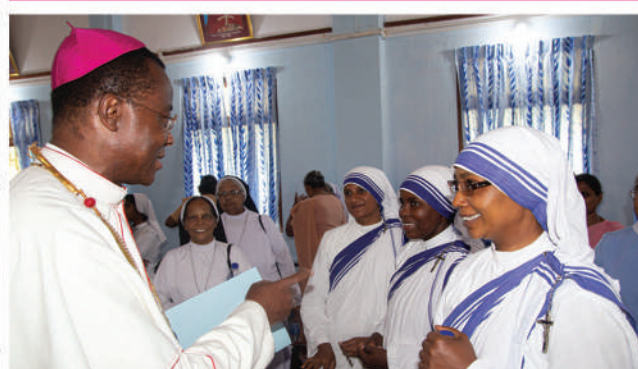
குருக்கள் துறவியர்களுடன் ஆயர் இன்வத்திள்