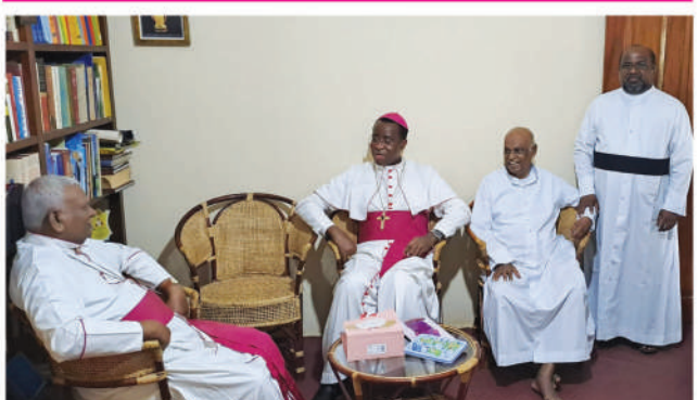
ஐம்புரிவலை ஆயர், குருக்களுடன் - பெரிஸ் இன்வம்