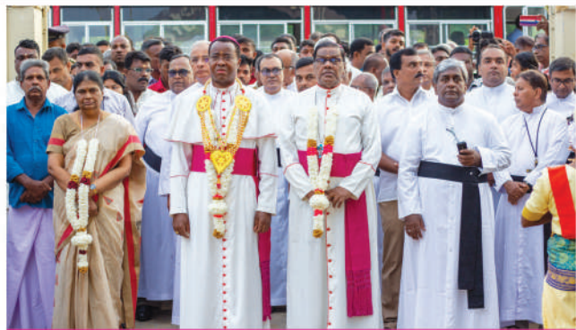
குருகல் புனித யாகப் பர் ஆஸைத் திருவிழா