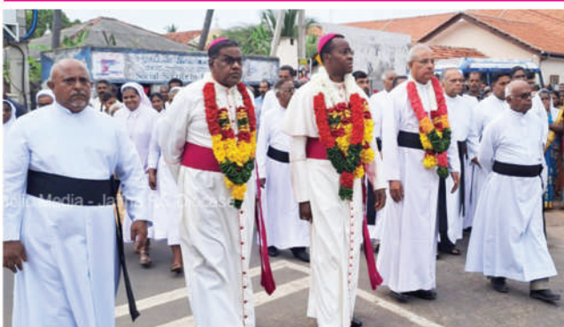
புனித அன்னாள் ஆஸைம், இளவாவை