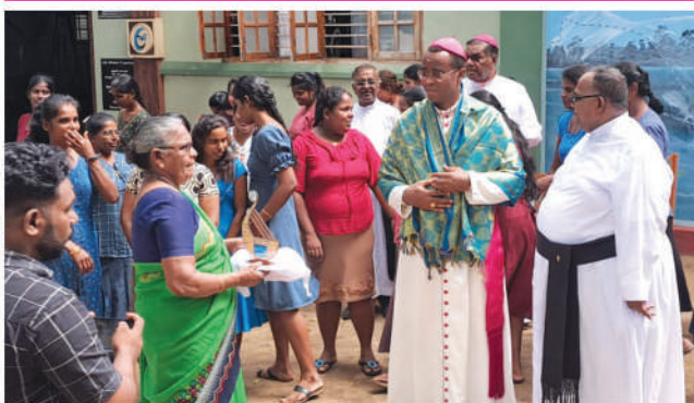
வாவர். பெளன்டேஷன் நியூயெத்திள்