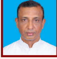
அருட்பணி. எடில் பால்

யாழ் மறைப்பூங்காவிலே இடுக்களாய் மலர்ந்து இடுள் பிணி நீக்கிட அடுப்பினியாளர்களாய் பணிக்குடுத்துவதில் ஆண்டுகள் இடுபுத்தெந்து கண்டு வெள்ளி விழாவில் மகிழ்வறும் எம் இடுக்களுக்காய் இறைவர உம்கு எழு நன்றிகள்