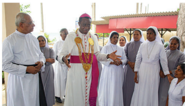
திருச்சீழையேவச் சுகரல ரிவையம்