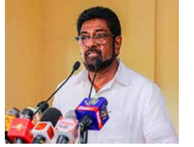
கடந்த நாட்களில் பதிவான மரணங்கள் அனபிலாக்கி அதிர்ச்சி காரணமாக ஏற்பட்டுள்ளதாகவும் சுகாதார அமைச்சர் குறிப்பிட்டுள்ளார்.

எவ்வாறாயினும், பொதுவான முடிவுகள் மற்றும் பரிந்துரைகள் உத்தியோகபூர்வமாக வெளியிடப்படும் என்றும் அமைச்சர் குறிப்பிட்டார். குறித்த அறிக்கைக்கு அமைய