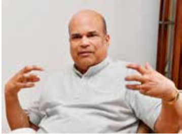
யத்தினால் மேலும் வலுப்படுத்தப்பட்டுள்ளது.

இந்தியாவின் பாதுகாப்பே எங்களின் பாதுகாப்பு. எங்கள் மத்தியில் நீண்ட கால நாகரீக உறவுகள் காணப்படுகின்றன. நாங்கள் ஒரே இரத்தத்தைக் கொண்டுள்ளோம். இரு நாடுகளுக்கும் இடையில் அதிக தொடர்பாடல்களும் நம்பிக்கையை கட்டியெழுப்பும் செயற்பாடுகளும் இடம்பெற்றுள்ளன. அவை இலங்கை ஜனாதிபதியின் விஜயத்தினால் மேலும் வலுப்படுத்தப்பட்டுள்ளது.