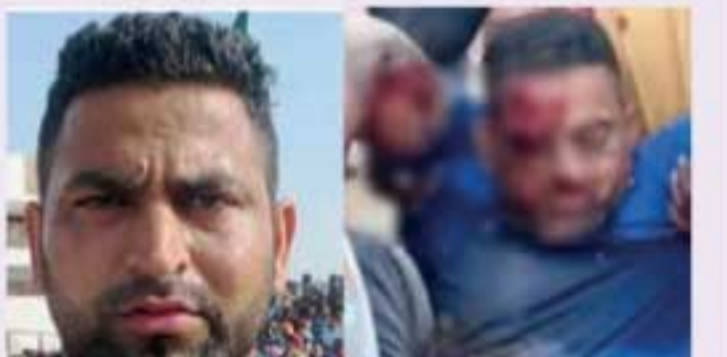
குடியேறியுள்ள சந்திப் சிங், தனது சொந்த ஊரில் கபடி போட்டிகளை நடத்தி வந்த நிலையிலேயே இவ்வாறு உயிரிழந்துள்ளார் எனத் தெரிவிக்கப்பட்டுள்ளது. இந்நிலையில் இது குறித்து மேலதிக விசாரணைகளை பொலிஸார் முன்னெடுத்துள்ளதாகத் தெரிவிக்கப்பட்டுள்ளது.

பஞ்சாப்பின் நகோதர் பகுதியில் உள்ள ஓதானத்திற்குள் புகுந்த மரம் கும்பலொன்று திடீரென அங்கிருந்த பிரபல கபடி வீரான சந்திப் சிங் என்பவர் மீது சரமாரியாகத் துப்பாக்கிச் சூடு நடத்திவிட்டுத் தப்பிச் சென்றுள்ளதாகத் தெரிவிக்கப்பட்டுள்ளது. நேற்று முன்தினம்(14) இடம்பெற்ற இத்துப்பாக்கிச் சூட்டில் சந்திப் சிங்கின் உடலில் 10 தோட்டாக்கள் வரை பாய்ந்துள்ள நிலையில் அவர் சம்பவ இடத்திலேயே உயிரிழந்துள்ளார். இங்கிலாந்தில்