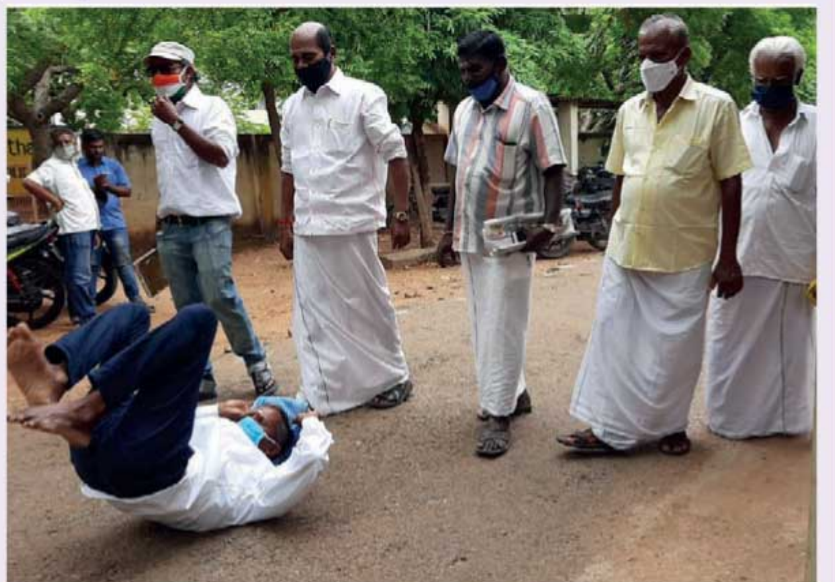
உறுப்பினர்கள் குட்டிக்கரணம் அடித்து நூதன போராட்டத்தில் ஈடுபட்டனர். இப்போராட்டமானது தூத்துக்குடி மாவட்டம் கோவில்பட்டி கோட்டாட்சியர் அலுவலகத்திற்கு முன்பாக நடைபெற்றுள்ளது.