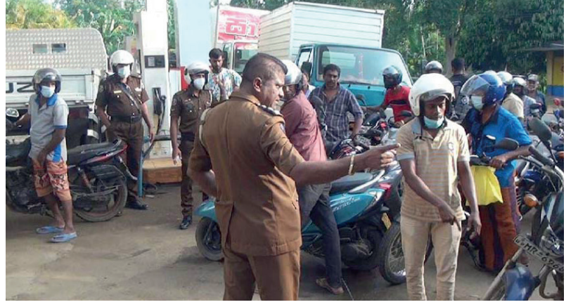
குறித்த எரிபொருள் நிரப்பு நிலையத்தில் மூன்று நாட்களாக எரிபொருளைப் பெற்றுக்கொள்ள மக்கள் வரிசைகளில் காத்திருந்த

அத்தியாவசிய தேவைக்காக ஒதுக்கப்பட்டிருந்த ஒரு தொகை பெற்றோல், பொலிஸாரால் பொதுமக்களுக்கு விநியோகிக்கப்பட்டுள்ளது. பிபிலை, மெதகம சிபெட் கோ எரிபொருள் நிலையத்தில், நேற்று (20) எரிபொருளை பெற்றுக்கொள்ள வந்தவர்களால் எதிர்ப்பு நடவடிக்கை முன்னெடுக்கப்பட்டது. இதன்போது பொலிஸார் தலையிட்டு, குறித்த எரிபொருள் நிலையத்தில் அத்தியாவசிய தேவைக்காக ஒதுக்கப்பட்டிருந்த பெற்றோலை, தலா 500 ரூபாய்க்கு பகிர்ந்தளித்துள்ளனர்.