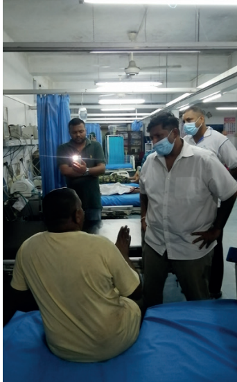
காயமடைந்தவர்களின் நலன் விசாரிப்பதற்காக, ஐக்கிய தேசிய கட்சியின் பிரதி தலைவர் ருவன் விஜேவர்தன, நேற்றுமுன்தினம் இரவு கோகாலை வைத்தியசாலைக்கு விஜயம் செய்திருந்தமை குறிப்பிடத்தக்கது.

ரம்புக்கனைய நகரில் நேற்று முன்தினம் (19) மாலை பொலிஸாருக்கும் ஆர்ப்பாட்டத்தில் ஈடுபட்ட பொதுமக்களுக்கும் இடையில் இடம்பெற்ற மோதலில், 42 வயதான ஒருவர் உயிரிழந்த நிலையில், காயமடைந்த 13 பொதுமக்களில் மூவர் கோகாலை வைத்தியசாலையின் அதிதீவிர சிகிச்சைப் பிரிவில் சிகிச்சைப் பெற்று வருவதாக வைத்தியசாலை தகவல்கள் தெரிவிக்கின்றன. அத்துடன், இச்சம்பவத்தில் காயமடைந்த 14 பொலிஸார், கண்டி வைத்தியசாலையில் சிகிச்சை பெற்று வருவதாகவும் காயமடைந்த ஏனையவர்கள் கோகாலை மற்றும் ரம்புக்கனைய ஆகிய வைத்தியசாலைகளில் சிகிச்சை பெற்று வருவதாகவும் தெரிவிக்கப்பட்டுள்ளது. இதேவேளை துப்பாக்கிச் சூட்டுக்கு இலக்காகி