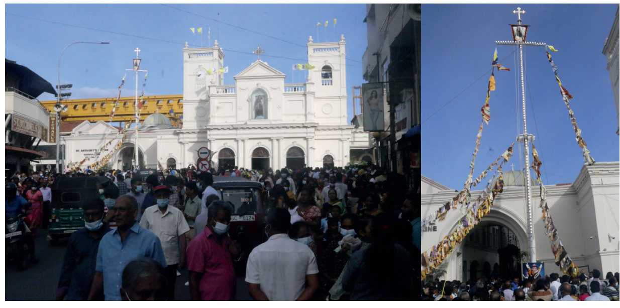
கொச்சிக்கடை புனித அந்தோனியார் திருத்தலத்தின் வருடாந்த திருவிழா கொடியேற்றத்துடன் நேற்று (03) ஆரம்பமானது. எதிர்வரும் 13ஆம் திகதி வருடாந்த திருவிழா நடைபெறும்.