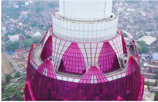
பல எச்சரிக்கைகள் மற்றும் அறிவிப்புகள் இருந்த போதிலும் அதையும் மீறி, கொழும்புத் தாமரைக் கோபு

ரத்தில் உள்ள கண்காணிப்புத் தளத்திற்குச் சேதம் விளைவித்த இளம் ஜோடி நேற்று பிடிபட்டதாக நிர்வாகம் தெரிவித்துள்ளது.