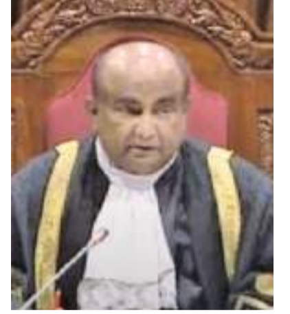
காரம் கிடையாது. அவ்வாறான எந்தவொரு உத்தரவு அல்லது நீதிமன்ற தீர்ப்பும் அரசியலமைப்பு மீறலாகவே அமையும்

இதன்போது அவர் மேலும் கூறியதாவது, பாராளுமன்ற நடைமுறையைப் பின்பற்றி நிறைவேற்றப்பட்ட யோசனைக்கு எதிராக, எந்தவொரு வகையிலும் உத்தரவு அல்லது தீர்ப்பை வழங்குவதற்கு இலங்கை அரசியலமைப்பின் கீழ் நிறுவப்பட்டுள்ள எந்தவொரு நீதிமன்றத்திற்கும் அநி