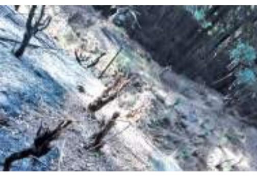
என்ப பலரும் மிகுந்த சிரத்தையுடன் தீயை கட்டுப்பாட்டுக்குள் கொண்டு வந்துள்ளதாக இடர் முகாமைத்துவ மையம் தெரிவித்துள்ளது.

ஓஹிய காட்டுப்பகுதிக்கு இனந்தெரியாதோரால் நேற்றுமுன்தினம் தீ வைக்கப்பட்டுள்ளது. ஓஹிய ரயில் வீதியின் கரங்கம் மேல் பகுதி வரையிலுள்ள பெறுமதி மிக்க மரங்கள் தீயில் எரிந்து சாம்பலாகியுள்ளதாக வன இலாகா அதிகாரிகள் தெரிவித்தனர். காட்டுத்தீ மேலும் வளம்பகுதிக்குள் பரவாமலிருக்க ஒஹிய வன இலாகா அதிகாரிகள், ரயில் ஊழியர்கள், தபால் நிலைய ஊழியர்கள், பொதுமக்கள்