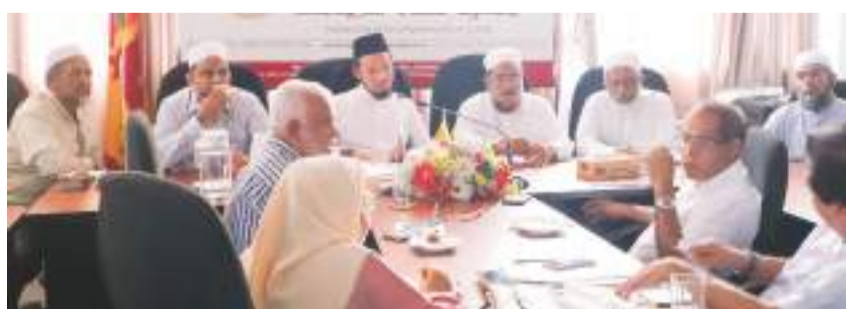
புழைகளுக்கு தாங்கள் உறுதுணையாக நிற்பதோடு சமூகத்தின் நலன் மற்றும் கருத்தொருமைப்பாட்டை கருத்தில் கொண்டு இத்திருத்தம் தொடர்பாக எட்ப்படும் ஏகோபித்த முடிவுகளுக்கு கூட்டிணைவோடும் புரிந்துணர்வுடனும் செயற்படுவதாகவும் சிறிலங்கா முஸ்லிம் கவுன்ஸில் உறுதியளித்தது. அத்துடன் கருத்து முரண்பாடுகளின்றி அனைவராலும் ஏற்றுக்கொள்ளப்பட்ட கதிமுறையில் பல திருத்தங்கள் மேற்கொள்ளப்பட வேண்டும் என்பதோடு, கருத்து முரண்பாடுள்ள விடயங்களில் உலமாக்களின் வழிகாட்டல்களோடு சிவில் சமூக அமைப்புகளின் கருத்துக்களையும் உள்வாங்கி பயணிக்க வேண்டும் என்று ஜம்இய்யத்துல் உலமா குறித்த கூட்டத்தின்போது வலியுறுத்தியது. மேலும் 1970 களில் இருந்து தற்பொழுதுவரைவிவாக, விவாகரத்து சட்டத்திருத்தம் தொடர்பில் ஜம்இய்யா குறித்த நிலைப்பாட்டில் உறுதியாக

முஸ்லிம் விவாக, விவாகரத்து சட்டத்திருத்தம் குறித்து சமூகத்தில் புரிதலையும் நல்லிணக்கத்தையும் ஏற்படுத்தும் நோக்கில் அகில இலங்கை ஜம்இய்யத்துல் உலமா மற்றும் சிறிலங்கா முஸ்லிம் கவுன்ஸில் ஆகிய இருதரப்புக்குமிடையில் கமுக சந்திப்பொன்று ஜம்இய்யாவின் தலைமையகத்தில் நடைபெற்றது. இச்சந்திப்பில் முஸ்லிம் விவாக, விவாகரத்து சட்டத்திருத்தம் சம்பந்தமாக முஸ்லிம் சிவில் சமூக அமைப்புகளால் முன் வைக்கப்பட்ட முன்மொழிவுகள் தொடர்பில் இருதரப்பு பிரதிநிதிகளுக்குமிடையில் நேற்று முன்தினம் நடைபெற்றன.