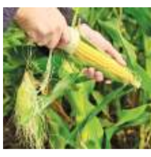
(இருத்தினபுரி சுழற்சி நிருபர்)

பலாங்கொடை பிரதேசத்தில் சோளம் செய்கை வெகுவாக பாதிக்கப்பட்டுள்ளதாக விவசாயிகள் மற்றும் விவசாய அமைப்புகளின் பிரதிநிதிகள் முறை மிடுகின்றனர். பலாங்கொடை பிரதேசத்தில் பரந்தளவில் சோள செய்கை மேற்கொள்ளப்படும் தியலின்ன கல் தோட்டை, வெளிப்பொதயாய, வேலிபுய பகுதிகளில் தமது விளைச்சல்கள் பல வழிகளிலும் பாதிப்படைந்துள்ளதாக இவர்கள் கவலை தெரிவிக்கின்றனர். கடந்த ஒரு மாதகாலமாக இப்பகுதியில் மழை பெய்யாமையால் ஆறுகள், குளங்கள், நீரிணைகள் உட்பட கிணறுகளும் பாதிப்படைந்துள்ளன. இதனால் சோளப் பயிர் செய்கைக்கு அவசியமான நீர் இல்லாமையால் மக்கள் பல்வேறு இன்னல்களுக்கு முகம்கொடுப்பதாக தெரிவிக்கின்றனர். இதனால் பொருளாதார நெருக்கடிகளை எதிர்கொண்டுள்ளதாக இவர்கள் தெரிவிக்கின்றனர்.