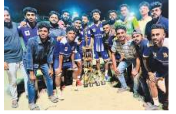
புத்தளம் கல்பிட்டிய யுனைட்டெட் விளையாட்டுக் கழகம் நடத்திய கால்பந்தாட்ட தொடரில் சம்பியன் கிண்ணத்தை வென்ற ஏறாபூர் இளந்தாரகை விளையாட்டுக் கழக வீரர்களை படத்தில் காணலாம்.