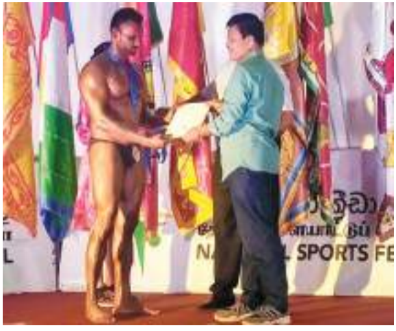
இங்கிரிய மத்திய குழுப் நிபுணர்