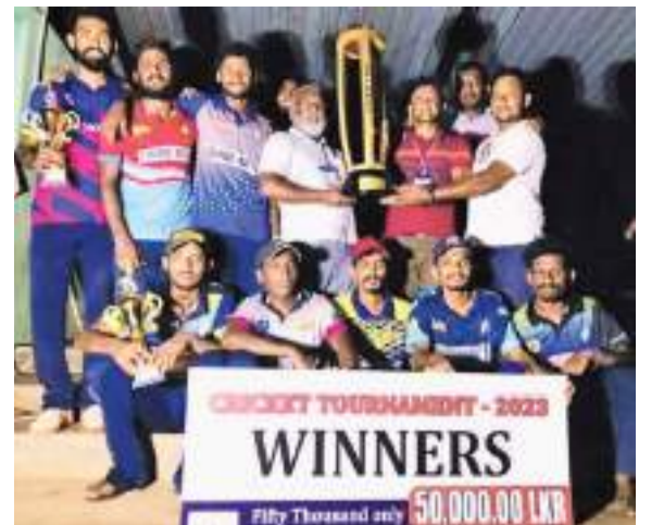
அநுராதபுரம் மேற்கு தினகரன் திருபுரம்

17 ஒருநாள் சர்வதேச போட்டிகளில் ஆடியபோதும் ஒரு போட்டியில் மாதிரிமே வெற்றியீட்டியுள்ளது. இதில் இங்கிலாந்து 15 போட்டிகளில் வெற்றியீட்டியுள்ளது. அதேபோன்று இங்கிலாந்துக்கு எதிராக இதுவரை 9 டி.20 சர்வதேச போட்டிகளில் ஆடி இருக்கும் இலங்கை அணி ஒரு போட்டியில் கூட வெற்றியீட்டியுள்ளதில்லை.