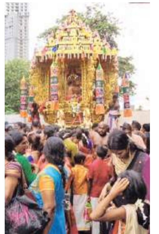
கொழும்பு கொம்பளித்தெரு ஸ்ரீ சிவசுப்பிரமணிய சுவாமிகள் தேவஸ்தானத்தின் வருடாந்த தேர்த்திருவிழா நேற்றைய தினம் ஊடம்பெற்ற போது சுவாமிகள் தங்க ஊரத்தல் வீதி வலம் வருவதை படத்தில் காணலாம்.