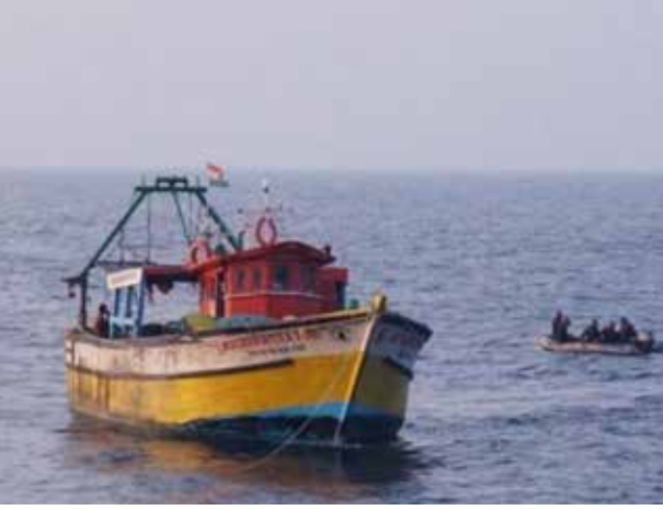
வேதாரணயத்துக்கு அருகே உள்ள கோடியக்

கரைக்கு தென்கிழக்கு கடல் பகுதியில் வலைவிரித்து மீன்பிடித்து கொண்டிருந்த, நாகை மாவட்டம் வேதாரணயம் அருகே உள்ள ஆறுகாட்டுத்துறை, வானவன் மகாதேவி உள்ளிட்ட பகுதிகளை சேர்ந்த மீனவர்கள் மீது தாக்குதல் நடத்திவிட்டு 7 லட்சம் ரூபா பெறுமதியான பொருட்களைப் பறித்துச் சென்றுள்ளதாகக் கூறப்படுகிறது.