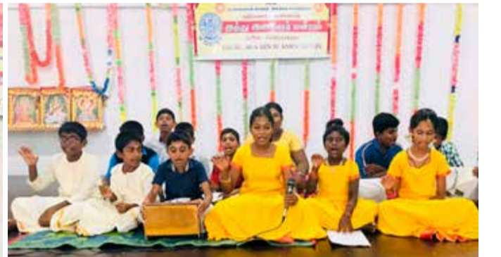
பண்டத்தரிப்பு - வடலியடைப்பு இந்து இளைஞர் மன்றம் நடத்திய சுந்தரமூர்த்தி நாயனார் குருபூசை நிகழ்வு நேற்று முன்தினம் முன்னெடுக்கப்பட்டபோது பதிவான படங்கள்.