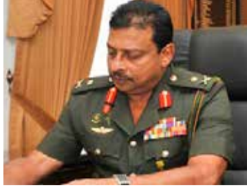
வேண்டியதில்லை என அவர் கூறினார்.

1987 இல் எந்த சூழ்நிலையில் இந்திய இலங்கை உடன்படிக்கை கைச்சாத்திடப்பட்டது என்பதை நினைவு கூர்ந்த அவர், யாழ். குடாநாட்டில் வடமராச்சி பிரதேசத்தில் படையினர் இராணுவ நடவடிக்கையில் ஈடுபட்டிருந்தனர். விடுதலைப் புலிகளின் தலைவரை பிடிக்கும் நிலையிலிருந்தனர் எனவும் குறிப்பிட்டுள்ளார்.