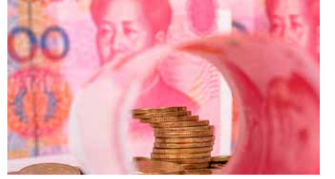
சீனாவின் ஏற்றுமதி 14.5 வீதம் சரிந்துள்ளது, அதே போன்று இறக்குமதி 12.4 வீதம் குறைந்ததுள்ளது என சீனா அரசின் தரவுகள் தெரிவிக்கின்றன. சீனாவின் வீட்டுமனை சந்தை திணறி வருகிறது. சீனா

உலகின் இரண்டாவது பெரிய பொருளாதாரம் கொண்ட நாடான சீனா, தற்போது தீவிர சிக்கலில் உள்ளது. பொதுவாக பணவீக்கம், அதாவது பொருட்களின் விலையேற்றத்தால் நாடுகளின் பொருளாதாரம் பாதிக்கப்படும். ஆனால் சீனாவை தற்போது வாட்டுவது, பணவாட்டம், அதாவது பொருட்களின் விலைகள் மளமளவென சரிந்து வருகின்றன.