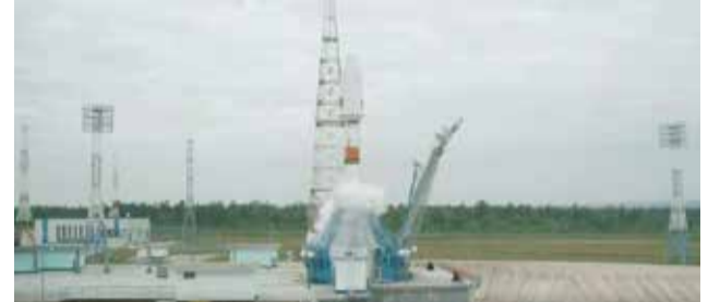
வின் கடைசி நிலவுப் பயணமான லூனா 24-ஐ நினைவு படுத்துகிறது.

ஏனெனில் முன்னாள் சோவியத் யூனியன் 50 ஆண்டுகளாக நிலவில் பல லேண்டர்களையும் ரோவர்களையும் வைப்பதில் வெற்றி பெற்றதுள்ளது. அந்த வகையில், ரஷ்யர்கள் நீண்ட காலத்திற்கு முன்பே பந்தயத்தில் வெற்றி பெற்றுவிட்டனர், அதற்கு மரியாதை செலுத்தும் வகையில், லூனா-25 என்ற பெயர், 1976 ஆம் ஆண்டு ரஷ்யா