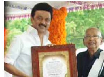
விளங்குவோருக்கு விருது வழங்கி சிறப்பித்தார். குறிப்பாக திராவிடர் கழக தலைவர் கி. வீரமணிக்கு தகைசால் தமிழர் விருதை முதலமைச்சர் மு. க. ஸ்டாலின் வழங்கினார்.

சென்னை, ஓக. 16 திராவிடர் கழக தலைவர் கி. வீரமணிக்கு தகைசால் தமிழர் விருதை வழங்கி முதலமைச்சர் மு. க. ஸ்டாலின் சிறப்பித்தார். சென்னை கோட்டை கொத்தளத்தில் நடைபெற்ற சுதந்திர நாள் விழாவில் தேசிய கொடியை ஏற்றி வைத்து மரியாதை செலுத்தினார். இதனை அடுத்து பல்வேறு துறைகளில் சிறந்து