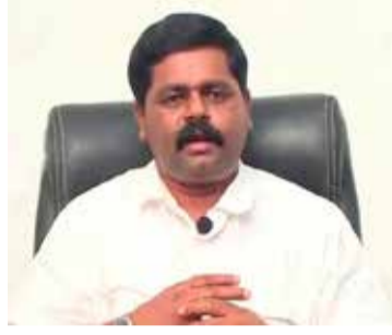
கள மக்களுக்கு காட்டி பெரிய அரசியலொன்றை செய்யலாம் என மேர்வின் சில்வா கருதுவதாக சிறீதரன் சுட்டிக்காட்டியுள்ளார். (ஐ)

அவர்கள் தலையை கொய்தால் நாம் கைகட்டி வேடிக்கை பார்ப்போம் என்று மேர்வின் சில்வா கருதுவது இந்த நவீன உலகத்திற்கு பொருந்துமா என்பதை காலம் தான் தீர்மானிக்க வேண்டும். பௌத்த விகாரைகளை தமிழர்கள் பிடுங்கிக் கொள்ளப்போவதாகவும் அதை தான் காப்பாற்றப்போவதாகவும் சிங்