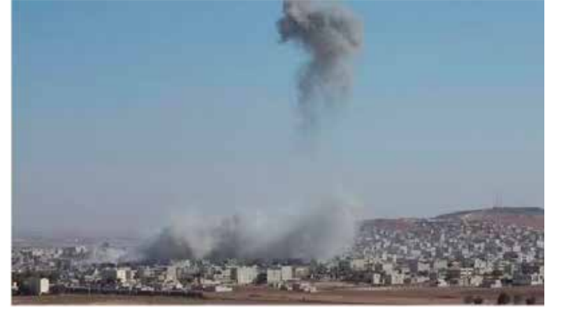
போது ரஷ்ய ஜனாதிபதி விளா டிமீர் புடன் தெரிவித்திருந்தார் என்பது குறிப்பிடத்தக்கது. (அ)