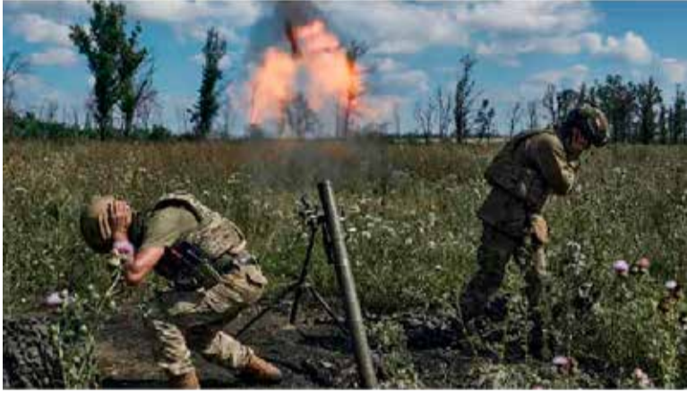
உக்ரைனுக்கு எதிரான போர் சில வாரங்களில் முடிந்து விடும் என போரை ஆரம்பிக்கும் போது ரஷ்ய ஜனாதிபதி விளா டிமீர் புடன் தெரிவித்திருந்தார் என்பது குறிப்பிடத்தக்கது. (அ)

ரஷ்யா, உக்ரைனுக்கு எதிரான போரை கடந்த 2022 ஆம் ஆண்டு பெப்ரவரி 24 ஆம் திகதி ஆரம்பித்தது. இரண்டு நாடுகளுக்கும் இடையிலான போர் ஆரம்பித்து சுமார் ஒன்றை வருடங்கள் கடந்துள்ளன.