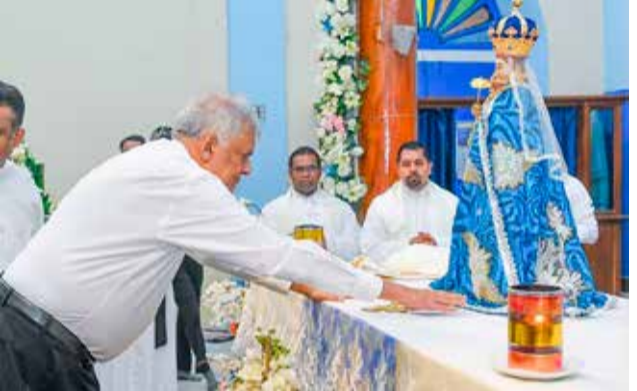
மடு மாதாவை வழிபடும் ஜனாதிபதி ரணில்