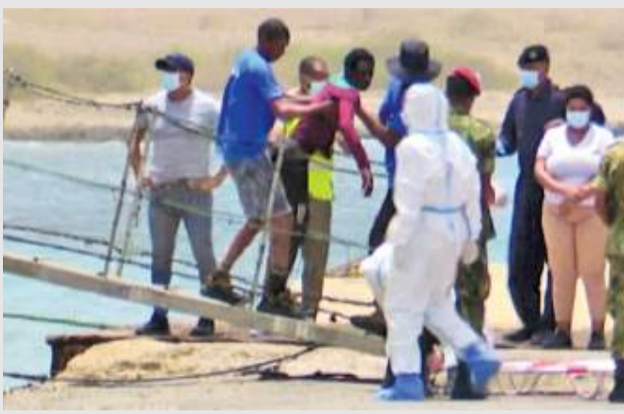
எப்பெயின் மீன்பிடி படகு ஒன்றால் கண்டுபிடிக்கப்பட்டது அது தொடர்பில் நிரவாகத் திறகு அறிவுறுத்தப்பட்டதாக பொலிஸார் தெரிவித்துள்ளனர்.

மேற்கு ஆபிரிக்காவில் கேப் வெர்டே தீவு நாட்டு கடலுக்கு அப்பால் தஞ்சக் கோரிக்கையாளர்களை ஏற்றிய படகு ஒன்று கண்டுபிடிக்கப்பட்டதை அடுத்து அதில் இருந்த 60க்கும் மேற்பட்டோர் உயிரிழந்திருப்பதாக அஞ்சப்படுகிறது. படகில் இருந்து சிறுவர்கள் உட்பட 38 பேர் உயிருடன் மீட்கப்பட்டுள்ளனர். இவர்கள் சால் கரைக்கு அழைத்துவரப்படுவதும் சிலர் தூக்குப் படுக்கையில் எடுத்து வரப்படுவதும் வீடியோ காட்சிகளில் தெரிகிறது. செனகலில் இருந்து வந்ததாக நம்பப்படும் இந்தப் படகில் இருந்தவர்கள் ஒரு மாதத்திற்கு மேல் கடலில் நிரக்கியாக இருந்துள்ளனர். மரபலகையால் செய்யப்பட்ட இந்தப் படகு கேப் வெர்டே துறைமுகமான சால் கரைக்கு அப்பால் சுமார் 320 கிலோ மீற்றர் தொலைவில்