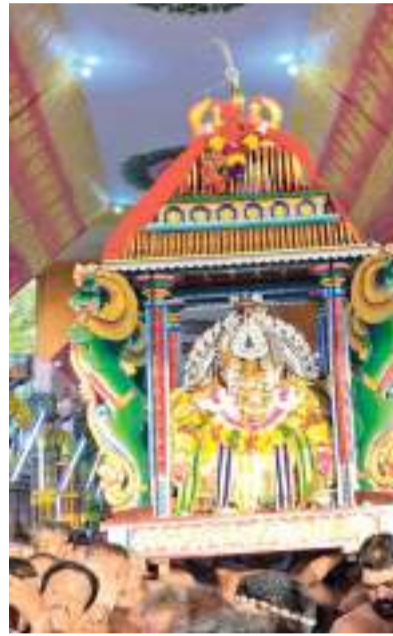
வரலாற்றுச் சிறப்புமிக்க யாழ்ப்பாணம், தொண்டமணறு செல்வச்சந்திரி ஆலயத்தின் வருடாந்த மகோற்சவத் திருவிழா கொடியேற்றத் துடன் நேற்று முன்தினம் புதன்கிழமை (16) பிற்பகல் மாலை 3.00 மணிக்கு ஆரம்பமாகியது.

யாழ்ப்பாண பல்கலைக்கழக சித்த மருத்துவ ஸீ சித்தி விநாயகர் ஆலய ஆவர்த்தன அக்ஷரத்தன மகா கும்பாபிஷேகம் எதிர்வரும் ஞாயிற்றுக்கிழமை (20) காலை 6.15 மணி முதல் 7.30 மணிவரையான கபநேரத்தில் நடைபெறவுள்ளது. இன்று (18) காலை 7.30 மணி முதல் விநாயகர் வழிபாடு உள்ளிட்ட சமயக் கிரியைகள் நடைபெறுவதுடன், நாளை (19) காலை 8.30 மணி முதல் மாலை 4.30 மணிவரை பக்தர்கள் எண்ணெய்க்காப்பு சாத்ததல் நடைபெறவுள்ளது. ஓகஸ்ட் 21ஆம் திகதி முதல் செப்டெம்பர் 3ஆம் திகதிவரை பிற்பகல் 3 மணி முதல் 5 மணிவரை மண்டலாபிஷேகமும் செப்டெம்பர் 4ஆம் திகதி காலை 8 மணிக்கு சங்காபிஷேகமும் நடைபெறவுள்ளது.