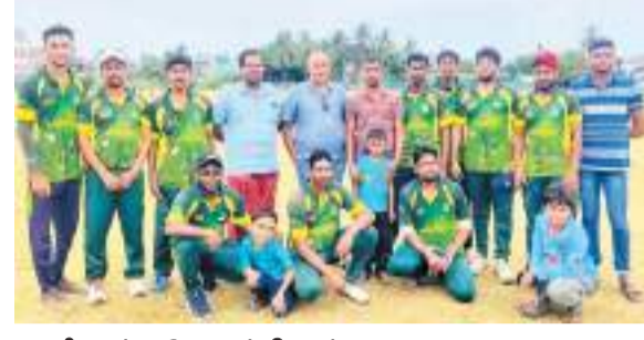
மாணிக்காடு குறுப் நிருபர்

மாவடி பேரில் விளையாட்டுக் கழகத்திற்கு எதிரான சினேகபூர்வ கடினப்பந்து கிரிக்கெட் போட்டியில் நித்தலூர் எமரெல்ட் அணி 5 ஓட்டங்களால் வெற்றியீட்டியது. நித்தலூர் பொது விளையாட்டு மைதானத்தில் அண்மையில் நடைபெற்ற இந்தப் போட்டியில் மாவடி பேரில் அணிக்கு 144 ஓட்டங்கள் வெற்றி இலக்காக நிர்ணயிக்கப்பட்ட நிலையில் அந்த அணி நிர்ணயிக்கப்பட்ட 17 ஓவர்களில் 4 விக்கெட் இழப்புக்கு 138 ஓட்டங்களையே பெற்றது.