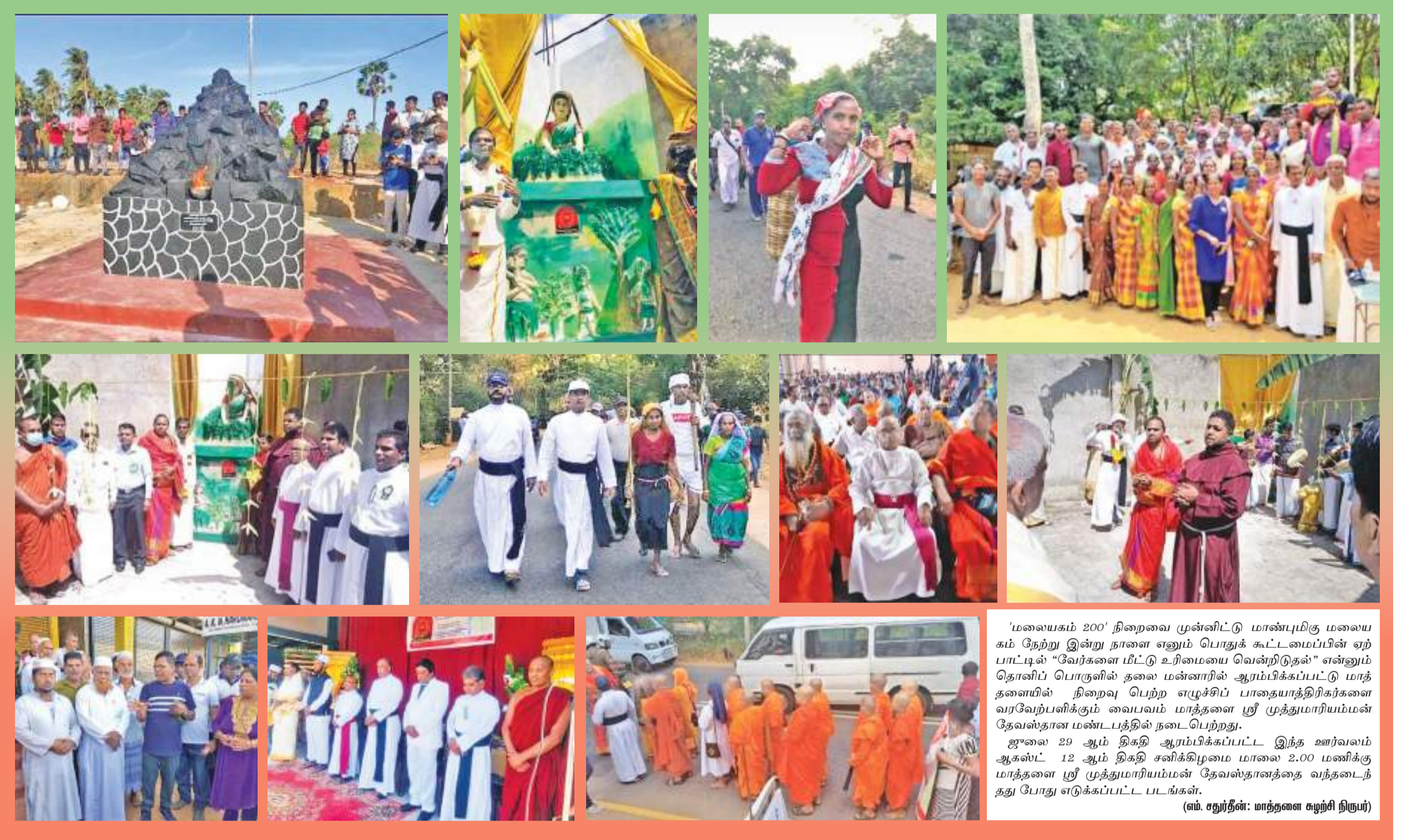
'மலையகம் 200' நிறைவை முன்னிட்டு மாண்புமிகு மலையகம் நேற்று இன்று நாளை எனும் பொதுக் கூட்டமையின்பின் ஏற்பாட்டில் "வேர்களை மீட்டு உரிமையை வென்றிடுதல்" என்னும் தொனிப் பொருளில் தலை மன்னாரில் ஆரம்பிக்கப்பட்டு மாத்தளையில் நிறைவு பெற்ற எழுச்சிப் பாதையாத்திரிகர்களை வரவேற்பளிக்கும் வடிவம் மாத்தளையின் முத்துமாரியம்மன் தேவஸ்தான மண்டபத்தில் நடைபெற்றது. ஜூலை 29 ஆம் திகதி ஆரம்பிக்கப்பட்ட இந்த ஊர்வலம் ஆகஸ்ட் 12 ஆம் திகதி சனிக்கிழமை மாலை 2.00 மணிக்கு மாத்தளையின் முத்துமாரியம்மன் தேவஸ்தானத்தை வந்தடைந்து து போது எடுக்கப்பட்ட படங்கள்.