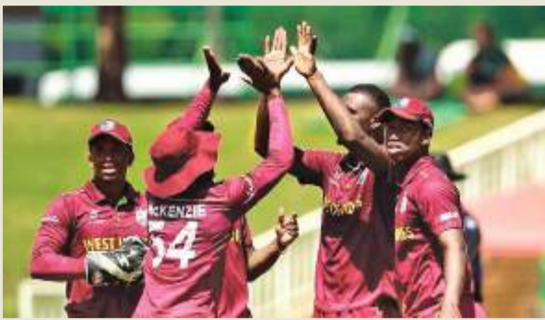
இதனைத் தொடர்ந்து இரு அணிகளுக்கும் இடையிலான நான்கு நாட்கள் கொண்ட இளையோர் டெஸ்ட் போட்டியின் முதல் ஆட்டம் செப்டெம்பர் 5 ஆம் திகதி தம்புள்ளையில் ஆரம்பமாகவுள்ளது. இரண்டாவது டெஸ்ட் போட்டியும் செப்டெம்பர் 12 தொடக்கம் 15 ஆம் திகதிவரை அதே தம்புள்ளையில் நடைபெறவுள்ளது.

இரு இளையோர் டெஸ்ட் மற்றும் மூன்று இளையோர் ஒருநாள் சர்வதேச போட்டிகளில் பங்கேற்பதற்காக மேற்கிந்திய தீவுகள் 19 வயதுக்கு உட்பட்ட அணி அடுத்த வாரம் இலங்கை சுற்றுப் பயணம் மேற்கொள்ளவுள்ளது. கொழும்பு கிரிக்கெட் கழக மைதானத்தில் எதிர்வரும் ஓகஸ்ட் 25 ஆம் திகதி நடைபெறும் பரிசீலிப் போட்டியுடனேயே மேற்கிந்திய தீவுகள் அணியின் இலங்கை சுற்றுப்பயணம் ஆரம்பமாகவுள்ளது. இதனைத் தொடர்ந்து இலங்கை இளையோர் அணிக்கு எதிரான முதல் ஒருநாள் போட்டி ஓகஸ்ட் 27 ஆம் திகதியும் இரண்டு மற்றும் மூன்றாவது ஒருநாள் போட்டிகள் ஓகஸ்ட் 30 மற்றும் செப்டெம்பர் 1ஆம் திகதிகளில் நடைபெறவுள்ளன. இந்த அணைத்துப் போட்டிகளும் தம்புள் னையில் நடைபெறவுள்ளன.