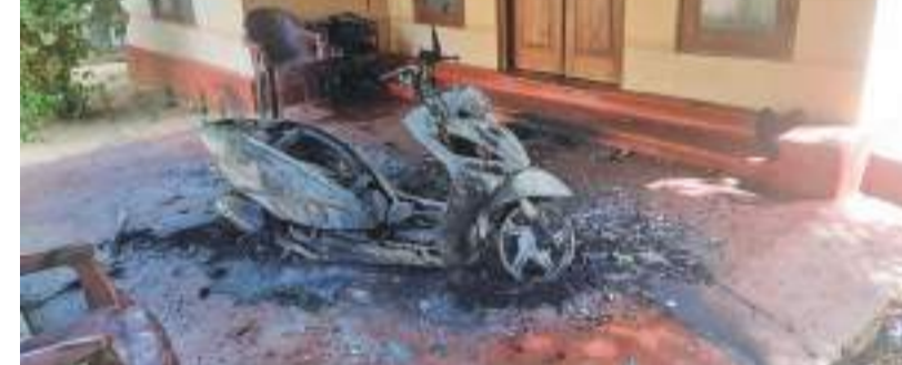
யாழ்ப்பாணம், சாவகச்சேரி பொலிஸ் பிரிவுக்குட்பட்ட அரசடி தாமோதரம்பிள்ளை வீதியை அண்டி அமைந்துள்ள வீடொன்றில் மோட்டார் சைக்கிளொன்று இனர்தெரியாத நபர்களால் நேற்று வியாழ்க்கிழமை (17) அதிகாலை 2.30 மணியளவில் தீக்கிரையாக்கப்பட்டுள்ளது. இந்த வீட்டில் பெண்கள் மாத்திரமே வசித்து வந்துள்ளதாக

வும் வீட்டு முன்வாசலில் நிறுத்தி வைக்கப்பட்டிருந்த மோட்டார் சைக்கிளே தீக்கிரையாக்கப்பட்டுள்ளதாகவும், பொலிஸார் தெரிவித்தனர். இந்தச் சம்பவம் தொடர்பாக சாவகச்சேரி பொலிஸாரிடம் பரதிக் கப்பட்ட தரப்பினர் முறைப்பாடு செய்துள்ளதுடன், இம்முறைப்பாட்டின் அடிப்படையில் பொலிஸார் விசாரணையை முன்னெடுத்து வருகின்றனர்.