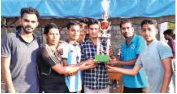
ஓடிவில் கிழக்கு தினகரன் நிருபர்

அட்டாணைச்சேனை ஹைலண்ட் விளையாட்டுக் கழகம் ஏற்பாடு செய்த பிரிமியர் லீக் கிரிக்கெட் சுற்றுப் போட்டியில் லயன்ஸ் அணி சம்பியனானது. இதன் இறுதிப் போட்டியும் பரிசளிப்பு நிகழ்வும் எப். பசித் தலைமையில் அட்டாணைச்சேனை ஆலம் குளம் மைதானத்தில் நேற்று முன்தினம் (16) நடைபெற்றது. இதில் லெஜென்ஸ் அணியை எதிர்கொண்ட லயன்ஸ் அணி நிர்ணயிக்கப்பட்ட 61 ஓட்ட வெற்றி இலக்கை 4 விக்கெட்டுகளை இழந்து பெற்றது.