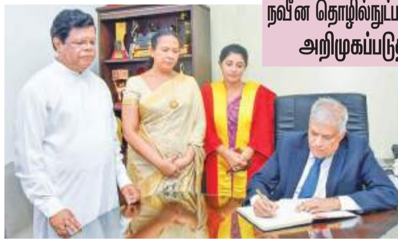
நவீன தொழில்நுட்பத்துக்கான உகந்த கல்விமுறை அறிமுகப்படுத்தப்படும் - ஜனாதிபதி

மாறிவரும் உலகுடன் இசைவாகக் கம் அடைய இலங்கை சிறுவர்கள் எதிர்காலத்தில் ஹிந்தி மற்றும் சீன மொழிகளைக் கற்றுக்கொள்ள வேண்டுமென ஜனாதிபதி ரணில் விக்கிரமசிங்க தெரிவித்தார். எதிர்கால உலகளாவிய சவால் களுக்கு முகம்கொடுக்கக்கூடிய மற்றும் நவீன தொழில்நுட்பத்துக்கு ஏற்ற கல்வி முறையொன்று நாட்டுக்கு அறிமுகப்படுத்தப்படுமென்றும் ஜனாதிபதி ரணில் விக்கிரமசிங்க தெரிவித்தார். உலகப் பொருளாதாரம் விந்ஞானம் மற்றும் தொழில்நுட்பத்தை அடிப்படையாகக் கொண்ட பல்வேறு துறைகளைச் சார்ந்துள்ளதால், செயற்கை நுண்ணறிவு, ரோபோ தொழில்நுட்பம், வலுவாகிய சேமிப்பு, வலைப்பதிவு மினெக் செமின் தொழில்நுட்பம் மற்றும் ஜெனோம் விஞ்ஞானம் போன்ற துறைகள் இன்று உலகப் பொருளாதாரத்தில் தாக்கம் செலுத்துவதாகவும் ஜனாதிபதி சுட்டிக்காட்டினார்.