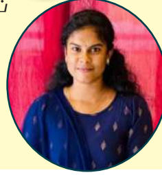
சுகிருந்திகா உளவியல் துறையாழ்ப்பாணப் பல்கலைக்கழகம்

தனிநபர் இடைவெளியானது நபர்களின் நெருக்க நிலையின் அடிப்படையில் வேறுபடுவதுடன் தனிநபர்களின் காரணிகள், பால்நிலை, உள நிலை, சூழல் காரணிகள் மற்றும் கலாசாரக்காரணிகள் முதலிய