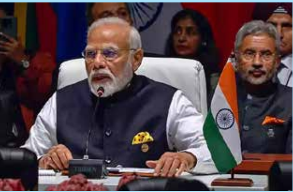
நிறுத்தியுள்ளது. நிலவின் தென்பகுதியைத் தொட்ட முதல் நாடாகவும் இந்தியா சாதனைப் புத்தகங்களில் இடம்பிடித்துள்ளது. (04)

அமெரிக்கா, சீனா, ரஷ்யா ஆகிய நாடுகளுக்குப் பிறகு நிலவின் மேற்பரப்பில் வெற்றிகரமாக தரையிறங்கிய நான்காவது நாடாக இது இந்தியாவை நிலை