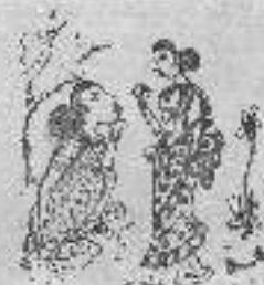
உலக மதுரை என்னை பேசுமுகுடு பொன்னர்.