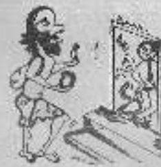
சுவராய்: ஸ்ரீ சிவராய் பேசியிருவர்.

இரு இலத்தீன் அமெரிக்க நாடுகளில் போட்டி ஆர்ஜென்டினாவின் ரசிகர்கள் பத்து பெரிய படகுகளில் உருகுயேயில் தலை நகரான மான்சுவிடினாவிற்குப் பறையெடுத்தனர். தலைமுக்கத்தில் பால்கரமான பட்டாசு வெடிகள்! "வெற்றி அல்லது மரணம்!" என்ற ஸுயிக் கண்ணீர் வலர்களில் முடிக்கம்! ஸ்ரேடிமம் தொண்டூறாவிடத்தும்