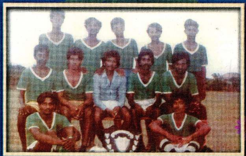
உருத்திரபரம் விளைபாட்டுக் கழகத்தின் வெற்றியின் வெற்றிக் கேடயத்தடன் வீரர்களோடு வீரராக