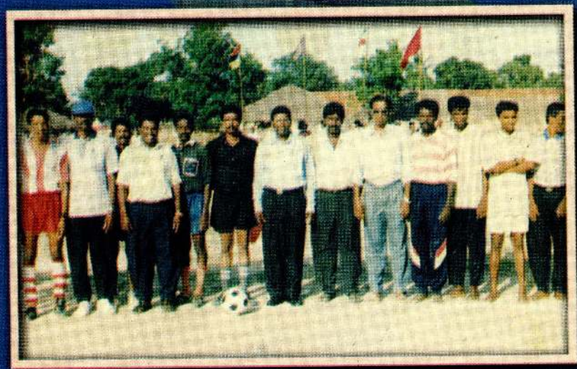
1995 இல் கிளிங்கந்தபுரம் பானியல் விளையாட்டு மைதானத்தில் இறுதி உதையந்தாட்ட கழக வீரருடன் அரசு அதிபர் உ.அ.அதிபர் மா.வி. அதிகாரிகளுடன் உதையந்தாட்ட நடுவராக