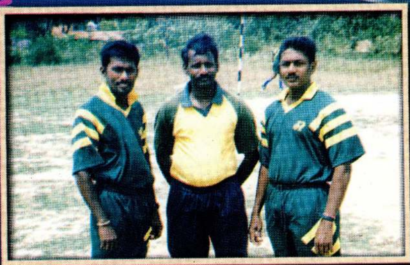
உருத்திரபுரம் விளையாட்டுக்கழக உதையந்தாட்ட வீரராக விளையாட்டு வீரர்களுடன்