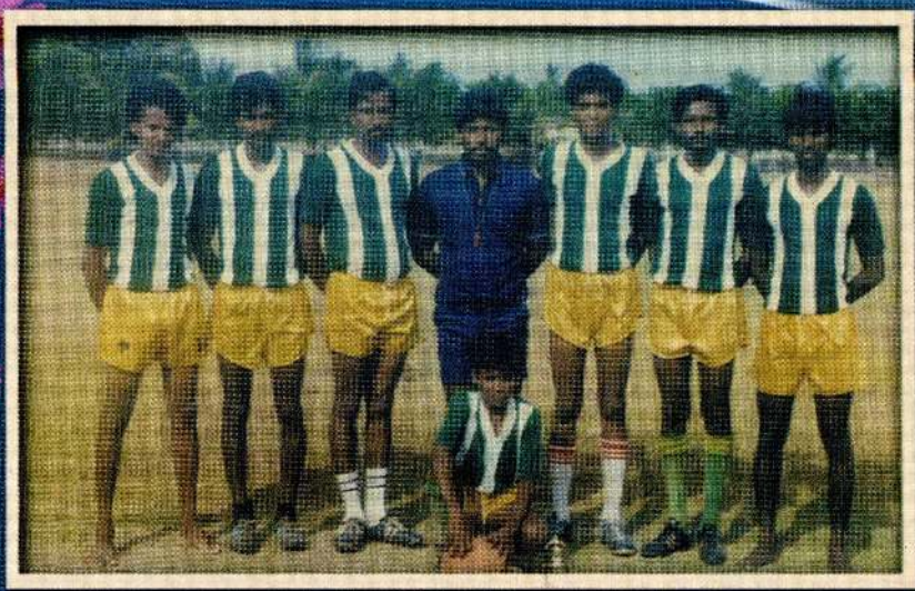
வினையாட்டு கழகங்களின் வீரர்களுக்கான பயிற்சிகளின் பயிற்று விப்பாளராக