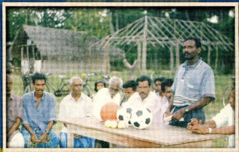
1996 இம் பெயர்வின் பின்னக மீள்கட்டுமான உதவியில் கனடா - உருத்திரபுரம் அயிவிருத்தி கழகத்தின் உருத்திரபுரம் பகுதி உருவினையாட்டுக் கழகம் உழவர் உன்றியம் ஆகியவற்றுக்கான வினையாட்டு கற்றல் உதவிகள் வழங்குதல் நிகழ்வுகளின் போது சேனையாளராக