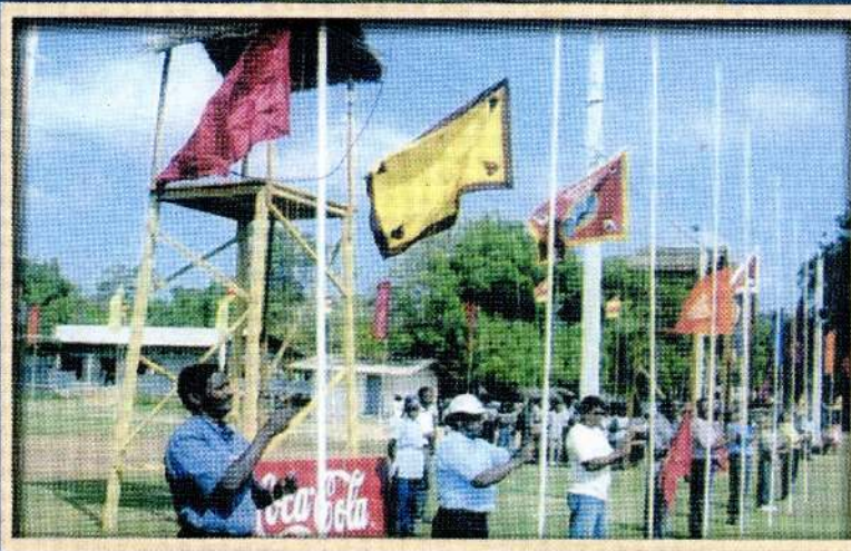
வன்னி பெருநிலப்பரப்பில் நிகழ்ந்த மெய்வல்லுனர் திறனாய்வின் போதான விளையாட்டுவிழாவின் தொடக்க நிகழ்வில் கொடியேற்றலின் போது