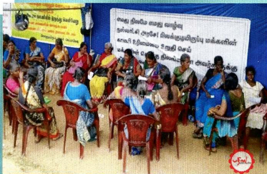
வன்னியில் நில அபகரிப்புக்கு எதிரான மக்கள் போராட்டம் கிளிநொச்சி மாவட்டம் - பரலிப்பாளையம் முல்லைத்தீவு மாவட்டம் - ஸேப்பாப்பல்லு