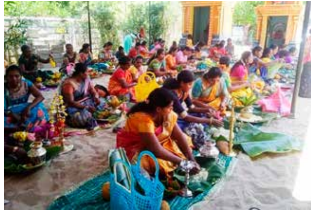
இந்து சுமங்கலிப் பெண்கள் அனுஷ்டித்து வரும் வரலட்சுமி விரதமானது நேற்று வெள்ளிக்கிழமை காரைதீவு சிறீ நாராயணன் சுவாமி ஆலயத்தில் வெகு சிறப்பாக நடைபெற்றது. (அ)

அத்துடன், நாட்டில் நெற்பயிர் செய்கை மேற்கொள்ளப்பட்ட 53 ஆயிரத்து 774 ஏக்கருக்கும் அதிகமான விவசாயநிலங்களும் வறட்சியினால் பாதிக்கப்பட்டுள்ளதாக விவசாய அமைச்சின் தரவுகள் தெரிவிக்கின்றன. (அ)