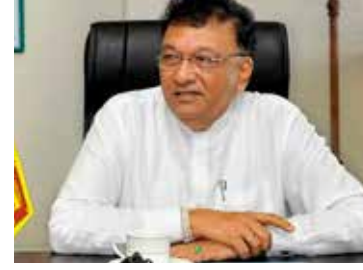
இதுதொடர்பாக அவர் தொடர்ந்து கருத்து வெளியிடுகையில்,

சம்பவம் தொடர்பில் தலங்கமை பொலிஸார் விசாரணைகளை மேற்கொண்டு வருகின்றனர்.