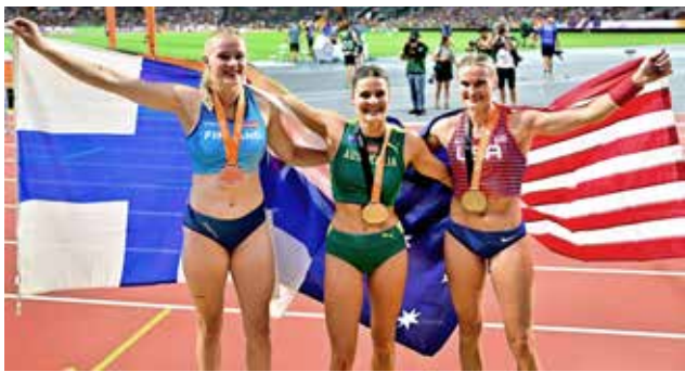
புடாபெஸ்ட், ஓக. 26 உலக தடகள சம்பியன்ஷிப்பில் மகளிருக்கான கோலூன்றி பாய்தல் போட்டியில் அவுஸ்திரேலியாவின் நிளா கென்னடியும், ஒலிம்பிக் சம்பியனான அமெரிக்க

காவின் கேட்டி மூனும் தங்கப் பதக்கத்தை பகிர்ந்து கொண்டனர். ஹங்கேரி தலைநகர் புடாபெஸ்ட்டில் உலக தடகள சம்பியன்ஷிப் போட்டி நடைபெறுகிறது. இதில் மகளிருக்கான கோலூன்றி பாய்தல் இறுதிப் போட்டியில் அவுஸ்திரேலியாவின் நிளா கென்னடியும் நடப்பு சம்பியனும் ஒலிம்பிக் சம்பியனான அமெரிக்காவின் கேட்டி மூனும் தலா 4.90 மீற்றர் உயரம் தாண்டி உலக சாதனை படைத்தனர். இருவரும் தலா ஒரு முறை இந்த அளவை தாண்டத் தவறினர். இதனால் வெற்றியாளரை தீர்மானிக்க நிளா கென்னடி, கேட்டி மூனிடம் போட்டி அதிகாரிகள் பேச்சு நடத்தினர். இதன் பின்னர் இருவருமே சம்பியன்களாக அறிவிக்கப்பட்டனர். பின்லாந்தின் வில்மா முர்டோ 4.80 மீற்றர் உயரம் தாண்டி வெண்கலப் பதக்கம் வென்றார். (ஐ)