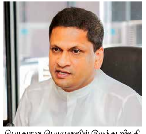
பொதுஜன பெரமுனவில் இருந்து விலகி சுயாதீனமாக இயங்குபவர்களை ஒருங்கிணைத்து பெரும் கூட்டணியொன்றை அமைக்கும் தீவிர முயற்சியில் ஈடுபட்டு வருகின்றமையும் சுட்டிக்காட்டத்தக்கது.

இதுபோன்ற குற்றச்சாட்டுகளுக்குப் பகிரங்க பதில் அளிக்கத் தயாராக இருப்பதாகவும் அவர் கூறியுள்ளார். பொதுஜன பெரமுன ஸ்தாபிக்கப்பட்ட போது இல்லாதவர்கள் தற்போது அதற்கு சொந்தக்காரர்களாக இருக்கின்றனர். இவர்கள்தான் கட்சியின் வரலாற்றை திரித்து பல்வேறு கருத்துகளை வெளியிட்டு வருகின்றனர். தேசிய பட்டியலில் வந்தவர்கள் வரலாற்றை திரித்து பேசுவதற்கு அவர் கண்டனத்தையும் வெளியிட்டுள்ளார். நிமல் லான்சா தலைமையிலான குழு,