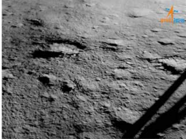
Portion of the Chandrayaan-3's landing site taken after landing

இந்தியா தனது சந்திரயான்-3 விண்கலத்தை வெற்றிகரமாக நிலவுக்குச் செலுத்தியது குறித்துப் படித்திருப்பீர்கள். இதன் பல காணொளிகளையும் நீங்கள் பார்த்திருப்பீர்கள். சென்னைக்கு வடக்கே 100 கிமீ தொலைவில், அண்டை மாநிலமான ஆந்திராவில் உள்ள சிறிஹரிகோட்டா சதீஷ் தவன் விண்வெளி மையத்திலிருந்து ஏவப்பட்ட இந்தக் கலம், தனது 45 நாள் பயணத்துக்குப் பிறகு, ஓகஸ்ட் 23, புதன்கிழமை, மிகத் துல்லியமாக மாலை 6.04 மணிக்கு நிலவில் மென்தரையிறக்கம் செய்தது. இந்த வரலாற்றுச் சாதனையை நிகழ்த்திய இந்திய விண்வெளி ஆராய்ச்சி நிறுவனத்தின் (ISRO) விஞ்ஞானிகளுக்கு உலகெங்கிலிருந்து பாராட்டுகள் குவிந்து வருகின்றன. இதுவரை யாரும் கால் வைத்திராத - கண்டறியாத, நிலவின் இருண்ட பகுதியான அதன் தென் துருவத்தில் சந்திரயான்-3 தரையிறங்கியிருப்பது, சர்வதேச அறிவியல் சமூகத்தைக் குதூகலப்படுத்தியுள்ளது. மேடு பள்ளங்களும் உறைபனியும் கனிம வளங்களும் நிறைந்த இந்தப் பகுதிக்கு விண்கலத்தை அனுப்பிய முதல் நாடு என்ற பெருமையை இந்தியா பெறுகிறது. இதுவரை நிலவில் மென்மையாகத் தரையிறக்கம் செய்த விண்கலங்களைச் செலுத்திய அமெரிக்கா, சோவியத் யூனியன் மற்றும் சீனா ஆகிய நாடுகள்கூட, அதன் தென் துருவத்தில் தரையிறக்க முயற்சிக்கவில்லை.