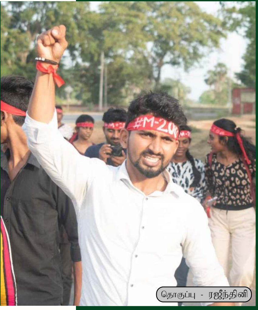
தொகுப்பு - ரஜீந்தினி