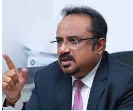
இனவாத மதவாத கருத்துக்களை எழுச்சி பெற வைத்து நாட்டு மக்களை மீண்டும் ஏமாற்ற முயலுகிறார்கள்.

குறிப்பாக சரத் வீரசேகர, உதய கம்மாம்பில்ல, விமல் வீரவன்ஸ மற்றும் அரசியலில் ஈடுபட்டுள்ள புத்த பிக்குகள் உட்பட பலர் அறகலய போராட்ட காலத்திலும் பின்னரும் தலைமறைவாக அஞ்சி வாழ்ந்தனர். போராட்டக்காரர்களிடம் இருந்து தப்பிக்க அவர்களின் கோரிக்கைகள் அனைத்தையும் ஏற்றுக் கொண்டனர். இன, மத பேதங்களை கட்டவிழ்த்து ஆட்சியாளர்கள் சிங்கள மக்களை ஏமாற்றி நாட்டைக் கொள்ளையடித்தனர் என்பதே போராட்டக் காரர்கள் முன்வைத்த வாதம். அதற்கு பரிகாரமாக முறைமை மாற்றத்தை கோரினர். புதிய அரசியல் யாப்பினை உருவாக்கி அக்கோரிக்கையை நிறைவேற்ற உறுதிமொழி வழங்கி மூச்சு விட்டவர்கள், அதை நிறைவேற்றாமல்