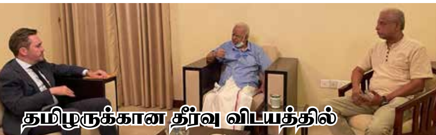
தமிழருக்கான தீர்வு விடயத்தில்

ஐ.நாவின் துலயீடு மேலும் வலுப்படுத்தப்பட வேண்டும்