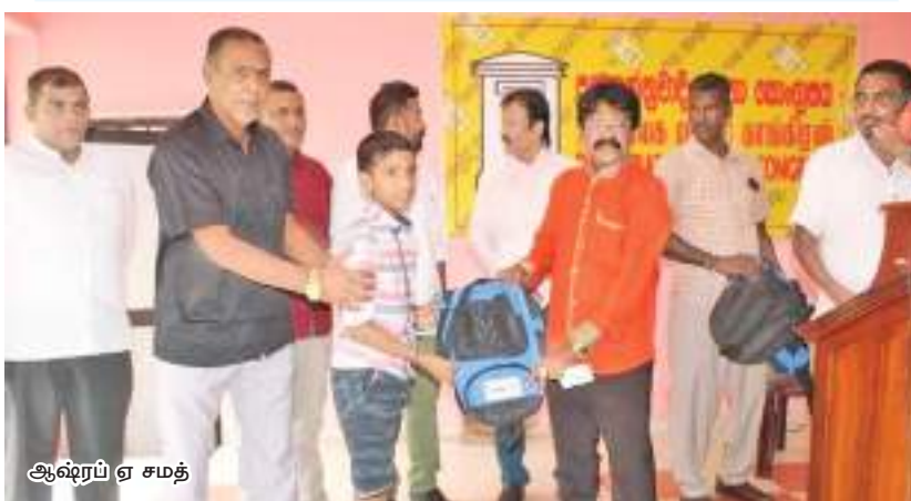
ஆஷ்ரஃபி ஏ சமத்

மதத்தலைவர்கள் அரசியல் அறிவுரை வழங்க வேண்டுமே தவிர அரசியல் செய்ய கூடாது. அவ்வாறு அரசியல் நடவடிக்கைகளில் தலையிட்டு தீர்மானங்களை மேற்கொள்ளும் போது அது நாட்டை பாரிய அழிவுக்கு இட்டுச்செல்லும்.