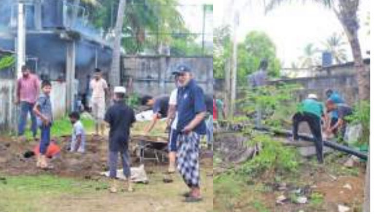
மொறட்டுவை, எகடையன் மஸ்ஜித் ஹஸனாத் ஜம்ஆப் பள்ளிவாசலின் புதிய நிர்வாக சபை பொறுப்பேற்றதன் பின்னர் ஏற்பாடு செய்த சிரமதான நிகழ்வு நேற்று முன்தினம் (30) பள்ளிவாசலில் பிரபல கலைஞர் மொஹிதீன் எம்.எஸ்.எம். ஹபீக் (இன்னாணி) தலைமையில் நடைபெற்றது. ஜமாஅத்தினர் உட்பட ஊர் மக்கள் சிரமதான பணிகளில் ஈடுபட்டுள்ளதை படங்களில் காணலாம்.