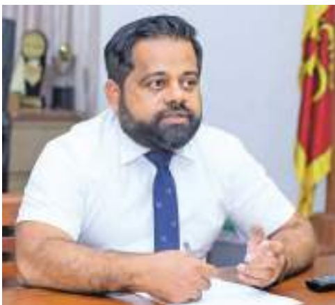
இலங்கை தெங்கு அபிவிருத்தி அதிகாரசபை பணிப்பாளர் நாயகம் ஜனக்க பிரேமரத்ன

தெங்கு அபிவிருத்தி அதிகாரசபையானது தெங்கு அபிவிருத்திக்காக உதவுகிறது. இரண்டாவது பணியாக தெங்கு ஏற்றுமதிக்காக உதவி புரிவதாகும். தென்னையினால் மேற்கொள்ளப்படுகின்ற உற்பத்திகளின் தரத்தை பரிட்சிப்பது முன்றாவது பணியாக குறிப்பிடலாம். இதனால் தெங்கு தினமும் எமக்கு மிக முக்கியமானது. தென்னம் பூ காயுவதற்கு ஓர் ஆண்டு வரையான காலம் எடுக்கிறது. அவ்வாறு காலம் எடுத்து உருவாகும் தேங்காய் ஒன்றின் மூலம் 150 உற்பத்திகளை மேற்கொள்ள முடியும் என்பதே ஒரு அபிமானமாகும். இந்த உற்பத்திகளில் 40 வரையானவை மட்டுமே ஏற்றுமதி செய்யப்படுகின்றது. ஆனால் 150 உற்பத்திகளை மேற்கொள்ள முடியும் என்றால் அதுவே எமது வெற்றியாகும். இந்த சர்வதேச தெங்கு தினத்தின் ஊடாக எமது தென்னைச் சார்ந்த 150 உற்பத்திகளையும் வெளிநாட்டு சந்தைக்கு அறிமுகம் செய்ய நாம் நடவடிக்கை எடுத்துள்ளோம். இங்கு கைத்தொழில் துறையின் முன்னேற்றத்திற்காக மற்றும் இருக்கின்ற தடங்கல்களை நீக்குவதற்கு தெங்கு தினத்தை பயன்படுத்துகிறோம். தெங்கு முக்கோணம் என்ற இலங்கையின் வேருன்றிய கோட்பாட்டை யாழ்ப்பாணத்தில் ஏற்படுத்துவதற்கு நாம் ஆலோசித்தோம். அதன்படி தென்னை அதிகம் உள்ள பகுதிகளில் தெங்கு சார்ந்த உற்பத்திகளை மேற்கொள்கின்ற தொழிற்சாலைகளை ஏற்படுத்தி அதிக நன்மையை பெற முடியும். தொழில்துறையில் புதிய தொழில்நுட்பத்துடன் முன்னோக்கி வந்துள்ளோம். எமது நாட்டின் உற்பத்திகளின் தரம் மிக உயர்ந்தது என்று வெளிநாடுகள் கூறுகின்றன. இது பெருமை கொள்ள வேண்டிய விடயமாகும்.