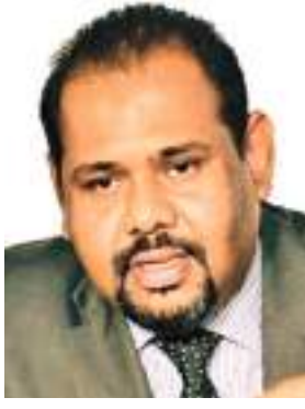
இது தொடர்பாக அவர் மேலும் தெரிவித்த போது, "இ அழிப்பு இடம்பெற்று வந்த காலத்தில் கூட நாங்கள் சிங்கள மக்களின்

நாங்கள் பெளத்த மதத்துக்கோ, சிங்கள மக்களுக்கோ எதிரானவர்கள் கிடையா தென, தமிழ்த் தேசிய மக்கள் முன்னணியின் தலைவரும் பாராளுமன்ற உறுப்பினருமான கஜேந்திரகுமார் பொன்னம்பலம் தெரிவித்தார். இது தொடர்பாக கடந்த செவ்வாய் (29) ஊடகங்களுக்கு கருத்துத் தெரிவித்த போதே, அவர் இவ்வாறு தெரிவித்தார்.