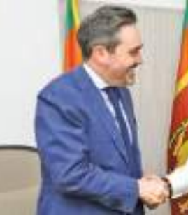
நாட்டின் சமூக, பொருளாதார, அரசியல் விடயங்கள் தொடர்பாக இரு தரப்பினருக்குமிடையில் பல்வேறு கருத்துகள் இன்போது பரிமாறப்பட்டன. நாட்டில் நிலவிவரும் தற்போதைய அரசியல் நிலைமைகள் தொடர்பாக ஐக்கிய நாடுகள் சபையின்