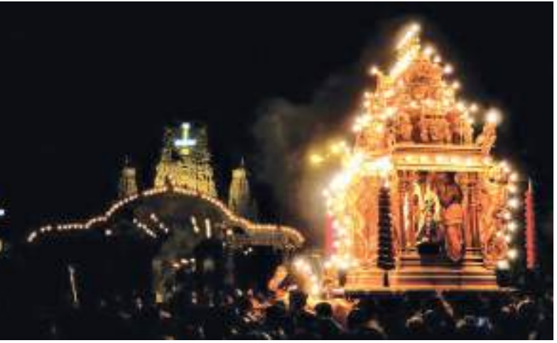
நல்லூர் 10ஆம் திருவிழாவான மஞ்சு திருவிழா நேற்றுமுன்தினம் மாலை நடைபெற்றது. முத்துக்குமாரசாமி மற்றும் வள்ளி, தெய்வானை ஆகியோர் மஞ்சத்தில் எழுந்தருளி பக்தர்களுக்கு அருட்காட்சியளித்தனர். (படம் யாழ்.விசேட நிருபர்)

தலைவர் திணைக்களப் பெறுகைக்குழு, அரசாங்க இரசாயனப் பகுப்பாய்வாளர் திணைக்களம், இல.31, இசுரு மாவத்த, பெலவத்த, பத்தரமுல்ல