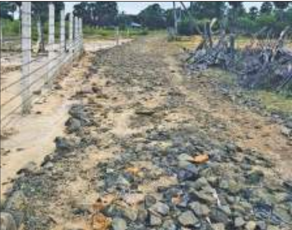
மூதார் பிரதேச செயலக பிரிவுக்கு உட்பட்ட நாணல்சேனை கிராமிய வீதி, புனரமைக்கப்படாது கற்கூடைக் காணப்படுவதை படத்தில் காணலாம்.

லாளர் ஐ.எம்.எம். மன்சூரினால் வெளியிடப்பட்டுள்ள வேண்டுகோளிலே மேற்கண்டவாறு தெரிவிக்கப்பட்டுள்ளது. அந்த வேண்டுகோளில் மேலும் தெரிவிக்கப்பட்டுள்ளதாவது, சாய்ந்தமருது, மாளிகைக்காடு பிரதேசத்தில் உள்ள அனைத்து ஜும்ஆப் பள்ளிவாசல்களிலும் இன்று ஜும்ஆத் தொழுகையை தொடர்ந்து துஆப் பிரார்த்தனை மேற்கொள்வதற்கு தீர்மானிக்கப்பட்டுள்ளது. துஆப் பிரார்த்தனையில் அனைத்து ஜமாஅத் தினரும் கலந்து கொள்ளுமாறு தெரிவிக்கப்பட்டுள்ளது.