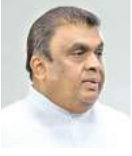
கணக்காய்வுக்கு உட்படுத்தப்படாத பிரிவுகளை கணக்காய்வுக்கு உட்படுத்துவது