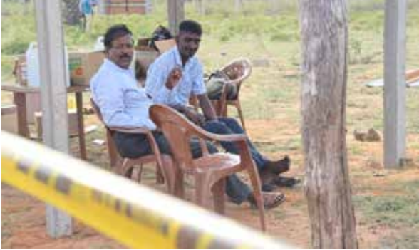
(முதலாம் பக்கத் தொடர்ச்சி)