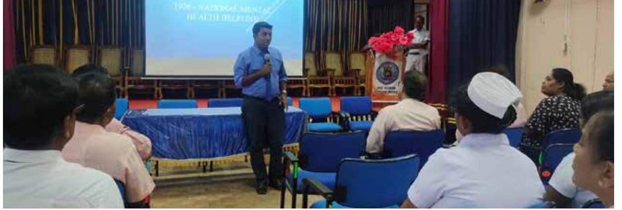
வேண்டும், என்றும் அறிவுறுத்தப்பட்டது. இறுதியில் கலந்துகொண்டவர்களும், ஊடகவிய

அண்மைக்காலத்தில் பாடசாலை மற்றும் பல் கலைக்கழக மாணவர்களுடைய தற்கொலைகள் அதிகரித்து வருகின்றன. தற்பொழுது பரீட்சைப் பெறுபேறுகள் வெளியாகியுள்ளன. தோல்வி அடைந்த மாணவர்கள் உளநல ஆலோசனை தேவைப்பட்டால் இந்த இலக்கத்தோடு தொடர்பு கொண்டு தங்களுக்கான தீர்வினைப் பெற்றுக்கொள்ளலாம். இதனை ஆசிரியர்கள் பெற்றோர்களும் அறிந்து அவர்களுக்கு உதவ