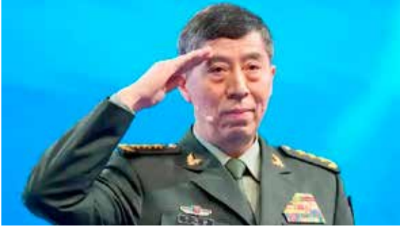
பீஜிங், செப். 18

சீனாவின் மத்திய இராணுவ ஆணையத்தின் கூட்டத்தில் எந்த விளக்கமும் இன்றி பாதுகாப்புத் துறை அமைச்சர் லீ ஷாங்பு இடம் பெறாத மையை தொடர்ந்து அவர் பதவியிலிருந்து அகற்றப்பட்டிருக்கலாம் என்ற சந்தேகம் எழுந்துள்ளது. இது குறித்து பி. ரி. ஐ. செய்தி நிறுவனம் தெரிவித்துள்ளதாவது, சீன இராணுவத்தின் தலைமை பீடமான மத்திய இராணுவ ஆணையத்தின் கூட்டம் வெள்ளிக்கிழமை நடைபெற்றது. இதில், ஆணையத்தின் துணைத் தலைவர் ஹீ வெய்ங்டாங், அரசியல் விவகாரங்களை மேற்பார்வையிடும் அட்மிரல் மியாவோ ஹுவா, ஏவுகணை படைத் தலைவர் ஷாங் ஷெங்மின் ஆகிய ஆணைய உறுப்பினர்கள் பங்கேற்றனர். ஆனால், இந்தக் கூட்டத்தில் அவசியம் பங்கேற்க வேண்டிய பாதுகாப்பு துறை அமைச்சர் லீ ஷாங்பு கலந்து கொள்ளவில்லை. அரசு தரப்பிலிருந்து இதற்கான எந்த விளக்கமும் அளிக்கவில்லை. மாவோ சேதுங்குக்கு பிறகு சீனாவின் மிக சக்திவாய்ந்த தலைவர் என்று அழைக்கப்படும் ஜனாதிபதி ஷி ஜின்பிங்குக்கு நெருக்கமானவரான