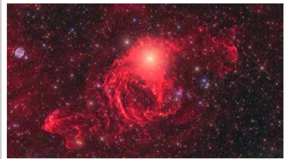
ஒரே உறைக்குள் இரு நட்சத்திரங்களை காட்டும் ஒளிப்படம் இது. அண்டரோமெடா விண்மீன் மண்டலத்துக்கு அடுத்த பெரிய பிளாஸ்மா ஆர்க்கின் இந்தப்படம் பெருமதிப்புக்குரிய வானியல் ஒளிப்பட விருதை வென்றுள்ளது.

கலிபோர்னியா, செப். 18 பயனர்களுக்கு தெரியாமல் இருப்பிடம் (லொக்கேஷன்) குறித்த விவரங்களை சேகரித்த விவகாரத்தில் கூகுள் நிறுவனத்துக்கு சுமார் 31 ஆயிரம் கோடி (இலங்கை) ரூபாய் அபராதம் விதிக்கப்பட்டுள்ளது. கலிபோர்னியாவின் சட்டமா அதிபர் தாக்கல் செய்த வழக்கில் இந்த அபராதம் விதிக்கப்பட்டுள்ளது. பல்வேறு காரணங்களுக்காக கூகுள் நிறுவனம் பயனர்களின் இருப்பிடம் சார்ந்த விவரங்களை சேகரிப்பது வழக்கம். அதற்கு பயனர்கள் இருப்பிடம் அம்சத்தை ஒன் செய்திருக்க வேண்டும். இதன் மூலம் பல்வேறு சேவைகளை பயனர்கள் பெற முடியும். இருப்பினும் தனிப்பட்ட விருப்பம் உட்பட பல்வேறு காரணங்களுக்காக பயனர்கள் லொக்கேஷனை நிறுத்தி வைத்திருப்பார்கள். இவ்வாறு நிறுத்தப்பட்டால் விவரம் சேகரிக்கப்படாது என கூகுள் தெரிவித்துள்ளது. இருப்பினும், பயனர்களின் இருப்பிட விவரம் சார்ந்த தரவுகளை கூகுள் சேகரித்ததாக சொல்லி அமெரிக்காவில் வழக்கு தொடரப்பட்டது. கூகுளின் இணைய சேவையை பயனர்கள் பயன்படுத்தும் போது அதன் மூலம் லொக்கேஷன் சார்ந்த தரவுகள் மாற்று வழியில் பயனர்களுக்கு தெரியாமல் சேகரிக்கப்பட்டதாக அதில் தெரிவிக்கப்பட்டது. இது உறுதி செய்யப்பட்டமையால் கூகுளுக்கு 9.3 கோடி டொலர்கள் அபராதம் விதிக்கப்பட்டுள்ளது. இந்த குற்றச் சாட்டை கூகுள் ஏற்றுக் கொள்ளவில்லை. மேம்படுத்தப்பட்ட புராதெக்ட் கொள்கை மூலம் இதற்கு தீர்வு கண்டுள்ளதாக சொல்லப்படுகிறது. இருப்பினும் இந்த அபராதத்தை செலுத்த கூகுள் ஒப்புக் கொண்டுள்ளது. (ஐ)