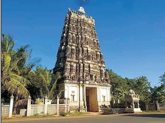
இலங்கையில் முதல் ராஜகோபுரம்

மாவிட்டபுரம் திருத்தலம் பொது யுகத்துக்குப் பின் (கி.பி) 789 ஆம் ஆண்டு (8 ஆம் நூற்றாண்டு) மன்னர்களால் கட்டப்பட்டது.