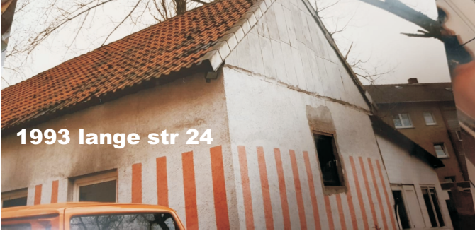
1993 lange str 24