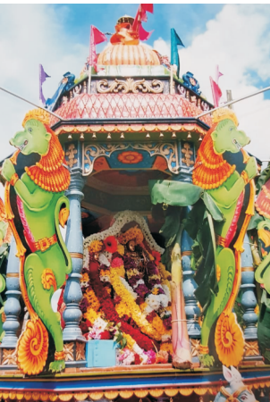
முதல் தேர் 1998