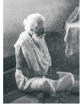
- யோக சுவாமிகள்

சஞ்சலம் வராமல் இவ்வுலகில் வாழவும் முடியுமோ? இவ்வுலகிற் பிறப்பதையே பிணியாகச் சொல்லப்பட்டிருக்கிற பொழுது சஞ்சலத்தைப்பற்றிச் சொல்லவும் வேண்டுமா? சஞ்சலம் வந்து கொண்டேயிருக்கும். ஆனால், அதனால் பாதிக்கப்பாடாமலிருக்கவும் வழி காட்டப்பட்டிருக்கின்றது. சற்குருவின் கடைசத்தாலும் மெய்யறிவைப் பெறுவதாலும் அவ்வழி எது வெனவறிந்து, அதைக் கடைப்பிடித்தொழுவுவோமாகில், சஞ்சலம் நம்மை அலைக்கவும் முடியாது. அசைக்கவும் முடியாது.