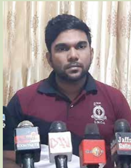
ஆய்வு கூட இரசாயன பதார்த்தங்களின் தட்டுப்பாடு அதிகரித்துக் காணப்படுகிறது.

இந்த விடயம் தொடர்பில் அவர் மேலும் தெரிவித்துள்ளவை வருமாறு- தற்போது மருந்துத் தட்டுப்பாடு, சத்திர சிகிச்சை உபகரணங்களின் தட்டுப்பாடு,