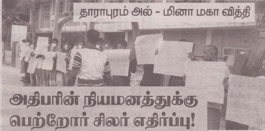
தாராபுரம் அல் - மினா மகா வித்தி