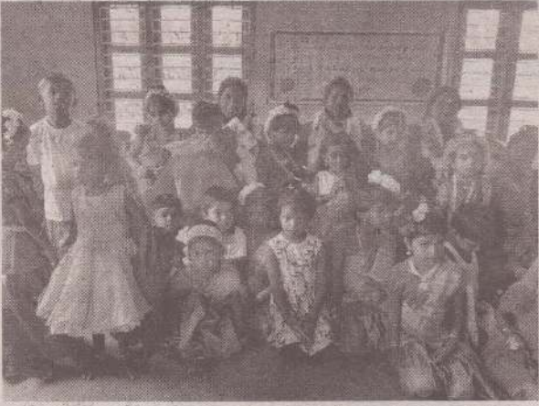
வேலணைப் பிரதேசசபையின் முன்பள்ளியில் சிறுவர்தின மற்றும் ஆசிரியர்தின நிகழ்வுகள் கடந்த திங்கட்கிழமை இடம்பெற்றன. (ச)