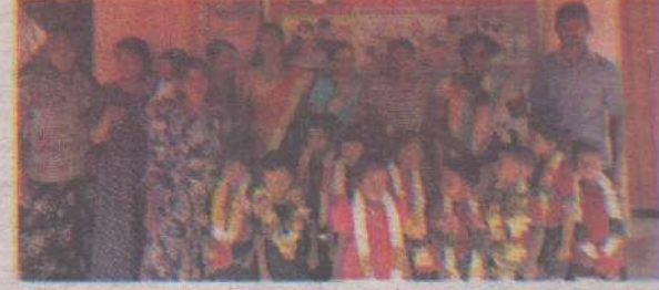
சண்டிலிப்பாய், கல்வளை பாரதி முன்பள்ளியில் சிறுவர்தின நிகழ்வுகள் அண்மையில் இடம்பெற்றன. (ச-63)

மன்னார், ஒக். 19 இலங்கைப் போக்குவரத்துச்சபைக்குச் சொந்தமான பேருந்தும் டிப்பர் வாகனமும் நேருக்குநேர் மோதி விபத்துக்குள்ளானதில் ஒருவர் காயமடைந்துள்ளார். ஏனையவர்கள் தெய்வாதீனமாகத் தப்பியுள்ளனர். இந்த விபத்துச் சம்பவம் முள்ளிக்குளம், மன்னார் வீதியில் நேற்றுமுன்தினம் செவ்வாய்க்கிழமை காலை இடம்பெற்றுள்ளது. முள்ளிக்குளத்தில் இருந்து மன்னார் நோக்கிப் பயணித்துக் கொண்டிருந்த இலங்கைப் போக்குவரத்துச்சபைக்குச் சொந்தமான பயணிகள் போக்குவரத்துப் பேருந்தும் எதிர்த்திசையில் வந்த டிப்பரும் மோதியதிலேயே இந்த விபத்து சம்பவித்துள்ளது. காயமடைந்தவர் சிலாவத்துறை மருத்துவமனையில் சேர்க்கப்பட்டுள்ளார். விபத்துத் தொடர்பில் மேலதிக விசாரணைகளை சிலாவத்துறைப் பொலிஸார் மேற்கொண்டு வருகின்றனர். (ச-213)