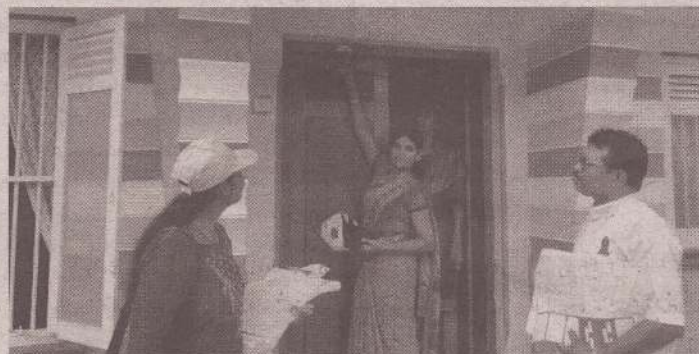
அதற்கமைவாக வவுனியா பிரதேசசெயலக பிரிவுக் குட்டட வைரவப்புளியங்குளம் கிராம அலுவலர் பிரிவில் இந்தச் செயற்பாடு நேற்று முன்தினம் வவுனியா கிழமை ஆரம்பிக்கப்பட்டது. (ச-18-110)

இந்தச் செயற்பாட்டில் மாவட்டச் செயலாளரின் வழிகாட்டலில் நிரல்படுத்தும் உத்தியோகத்தர்களாக கிராமஅலுவலர்கள், வெளிக்கள உத்தியோகத்தர்கள் நியமிக்கப்பட்டு, ஒவ்வொரு கட்டடங்கள் மற்றும் வீடுகளுக்குச் சென்று அங்கு வசிப்போரின்தகவல்கள் சேகரிக்கப்படுகின்றன.