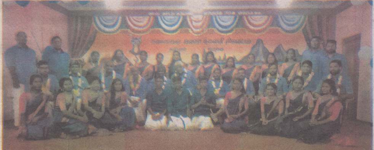
சங்கானைப் பிரதேசசெயலர் பிரிவுக்குட்பட்ட சுழிபுரம் மேற்கு கலைமகள் இலவசக்கல்வி நிலையத்தின் ஆசிரியர் தின விழா கூந்த சூழிற்றுக்கிழமை இடம்பெற்றது. (ம-125)

யாழ்ப்பாணம், ஒக். 19 யாழ்ப்பாணம், வட்டுக்கோட்டை 'ப்ரத்யங்கிரா' அறக்கட்டளையினரால் விழிப்புணர்வுக் கருத்தரங்கு கடந்த சனிக்கிழமை வட்டுக்கோட்டை யாழ்ப்பாணக் கல்லூரி மைதானத்தில் முன்னெடுக்கப்பட்டது. 'வேலியே பயிரை மேய்கின்றது' எனும் தொனிப்பொருளில் மாணவர்களுக்கு வாழ்வரிமை, போதை ஒழிப்பு, கல்வி உரிமை, இலஞ்ச உழல் ஒழித்தல், பாலியல் துஷ்பிரயோகம், நீதிமறுக்கப்படல், உயிர் மாய்ப்புச் சட்டத்தை மீறல், சுற்றுச்சூழல்களைப் பாதுகாத்தல் உள்ளிட்ட விடயங்கள் தொடர்பில் கருத்துரை நிகழ்வுகள் இடம்பெற்றன. (ச-63)