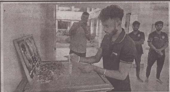
பொலிஸாரின் துப்பாக்கிச்சூட்டுக்கு இலக்காகிய உயிரிழந்த யாழ்ப்பல்கலை மாணவர்களின் 7ஆம் ஆண்டு நினைவேந்தல் நிகழ்வுகள் நேற்று முன்தினம் யாழ்ப்பல்கலைக்கழகத்தில் நடைபெற்றது.

கஞ்சா பொதிகளுடன் கைதான சந்தேகநபர்களை சாவகச்சேரிப் பொலிஸ் நிலையத்தில் அதிரடிப்படையினர் ஒப்படைத்துள்ள நிலையில் மேலதிக விசாரணைகளை பொலிஸார் முன்னெடுத்துள்ளனர். (நி-30)