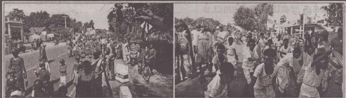
கிளி/தருமபுரம் இலக்கம் 1 அரசினர் தமிழகக் கலவன் பாடசாலை 65 ஆம் ஆண்டில் காப்பதிக் நாளின் முதல்நாள் நிகழ்வில் பாரம்பரிய கலாசார உடைகளில் நடைபவணி நேற்று இடம்பெற்றது.