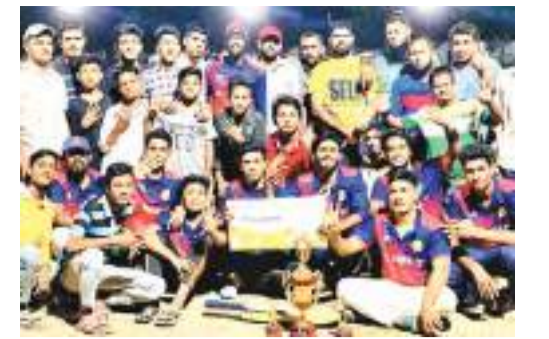
ஒலுவில் கிழக்கு தினகரன் நிருபர்