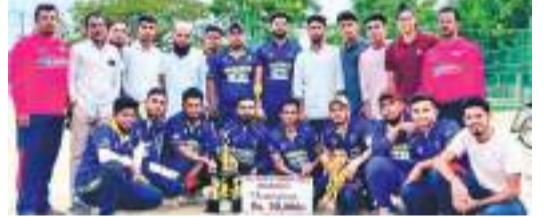
அக்கரைப்பற்று வடக்கு தினகரன் நிருபர்