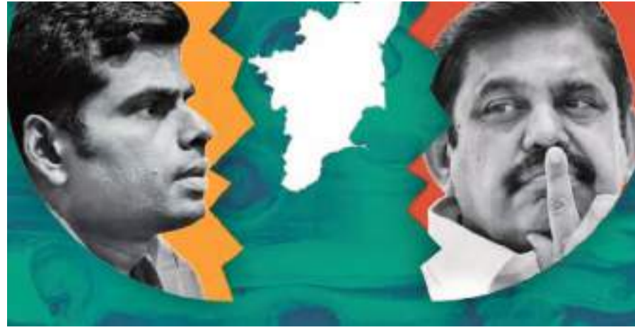
பின்னர் அதற்கு மன்னிப்பு கேட்ட நிலையில் இப்போது அண்ணாவை விமர்சித்துக் கொண்டிருக்கிறார் என்றார். சம்பந்தம் அறிஞர் அண்ணாவைப் பற்றி தவறான கருத்தை அண்ணாமலை

இந்த மோதலின் தொடர்ச்சியாக சென்னையில் நேற்று செய்தியாளர்களிடம் பேசிய அ.தி.மு.க மூத்த தலைவரான முன்னாள் அமைச்சர் ஜெயக்குமார், "அ.தி.மு.க கூட்டணியில் பா.ஜ.க இல்லை. எங்கள் கட்சியின் முடிவைத்தான் நான் அறிவிக்கிறேன். ஆரம்பத்தில் ஜெயலலிதாவை விமர்சித்து வந்தார் அண்ணாமலை."