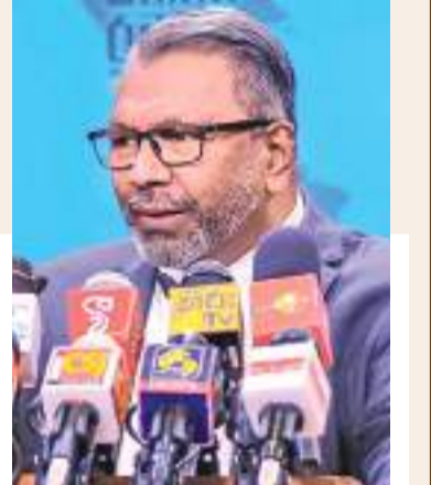
மேலும் தெரிவித்துள்ள அவர், கடந்த 12 மாதங்களில் 36 பகிடிவதை சம்பவங்கள் பதிவாகியுள்ளதுடன், கடந்த வருடங்களுடன் ஒப்பிட்டு கையில் பகிடிவதை