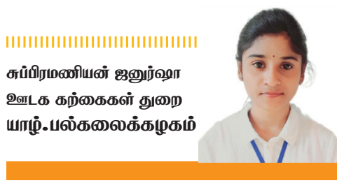
சுபிரமணியன் ஜனார்வா உடக கற்கைகள் துறையாழி-பல்கலைக்கழகம்

உள்ளங்கையில் உலகம் என விஞ்ஞான விந்தையின் விருத்தி நோக்கிய பாதையில் இன்றைய உலகமானது வியாபித்திருக்கின்றது. மனிதர்களிடையிலான ஊடாட்டமானது ஒவ்வொரு தனி நபர் வாழ்க்கை வட்டத்திற்கும் அவசியமான ஒன்றாகும். இவ் இடைவினையாற்றலுக்கு தொடர்பாடல் தவிர்க்க முடியாத அங்கம் என்ற வகையில், தகவல் பரிமாற்றச் செயற்பாட்டின் ஊடகமாக தொடர்பு சாதனங்கள் பயன்படுத்தப்படுகின்றன. தொடர்பாடலிற்கு உபயோகிக்கப்படுவதனால் இவை ‘தொடர்பு சாதனங்கள்’ என பெயர் பெற்றது போலும். தொலைவிலுள்ள நபருடன் இலகுவில் தொடர்பு கொள்வதற்கான வாய்ப்பினை தொடர்பு சாதனங்கள் ஏற்படுத்தி தந்துள்ளமையினால் இவை ‘தொலை தொடர்பு சாதனங்கள்’ எனவும் அழைக்கப்படுகின்றன.