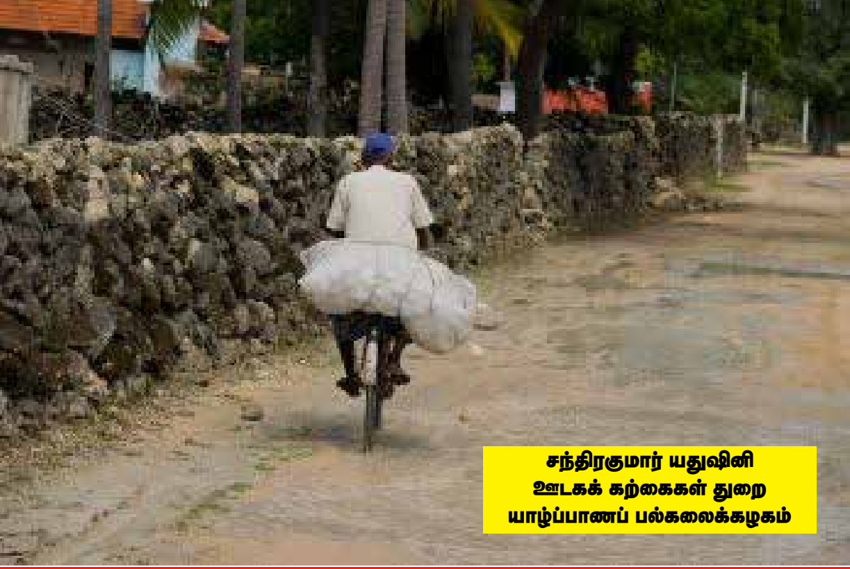
சந்திரகுமார் யதுவினி ஊடகக் கற்கைகள் துறை யாழ்ப்பாணப் பல்கலைக்கழகம்