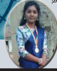
கணேசுமார் மதியந்தி ஊடக கற்கைகள் துறை இரண்டாம் வருடம்

இவ்வாறாக வருமான சமனின்மை நாடுகளுக்குள்ளும் நாடுகளுக்கு இடையேயும் தொடர்ச்சியாக அதிகரித்து காணப்படுவது நாடுகளில் பல சமூக, பொருளாதார, அரசியல் பிரச்சினைகளுக்கும் முரண்பாடுகளுக்கும் காரணமாக அமைகின்றது என்பது கவனத்தில் கொள்ள வேண்டிய முக்கிய விடயமாகக் காணப்படுகின்றது.