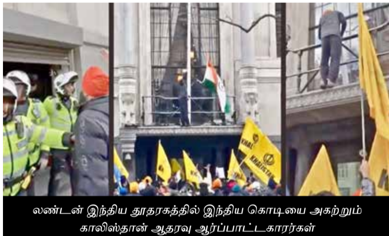
லண்டன் இந்திய தூதரகத்தில் இந்திய கொடியை அகற்றும் காலிஸ்தான் ஆதரவு ஆர்ப்பாட்டகாரர்கள்