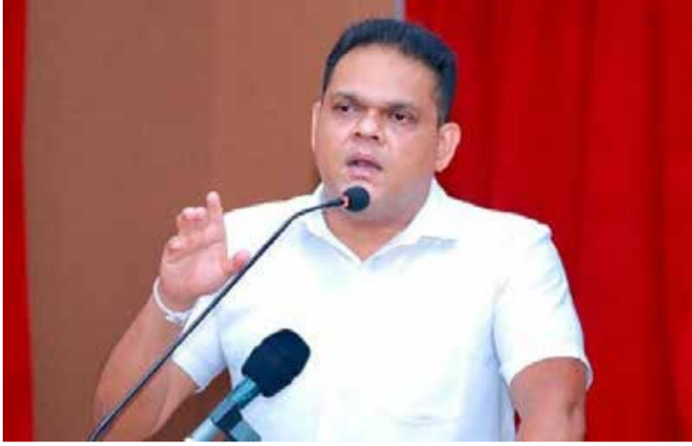
வேலைத்திட்டம் ஆகியவற்றின் முன்னேற்றம் குறித்து அறிவிக்கும் மாநாடொன்றிலேயே

அரசாங்கத்தின் புதிய வரிக் கொள்கை, சர்வதேச நாணய நிதியத்தின் வேலைத்திட்டம், அரச வருமானம் மற்றும் பொருளாதார ஸ்திரீப்படுத்தல்