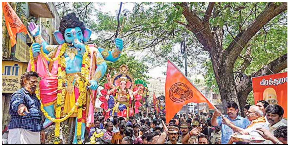
விநாயகர் சதுர்த்தியை ஒட்டி நேற்று முன்தினம் சென்னையில் பிள்ளையார் சிலைகளை கடலில் கரைப்பதற்காக ஊர்வலமாக எடுத்துச் செல்லப்பட்ட வேளை...!

களுக்கு அரசு வேலை வழங்க வேண்டும். தமிழக அரசில் உயர் பதவிகளில் வடமாநிலத்தைச் சேர்ந்தவர்கள்தான் நியமிக்கப்படுகின்றனர். பாராளுமன்றத்தில் எதிர்க்கட்சியினர் பேசும் போது, பா. ஜ. கவினர் குறுக்கிட்டு தரக்குறைவாகப் பேசுவது வருத்தமளிக்கிறது - என்றார். (ஐ)