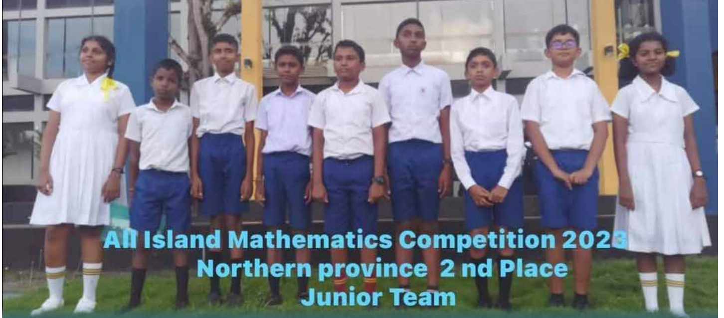
All Island Mathematics Competition 2023 Northern province 2nd Place Junior Team

இந்தச் செயலமர்வில் கல்முனை கார்மல் பற்றிமா தேசியக் கல்லூரி, பொத்துவில் முஸ்லிம் தேசியக் கல்லூரி மற்றும் பொத்துவில் அல் இர்பான் மகளிர் கல்லூரி ஆகிவற்றின் மாணவர்களும் துறைசார் ஆசிரியர்களும் கலந்து கொண்டனர்.