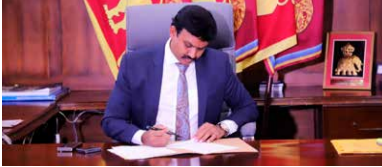
கிழக்கு மாகாணத்தில் தொடர்ந்தும் நிலவி வந்த ஆசிரியர் பற்றாக்குறையை கருத்தில்