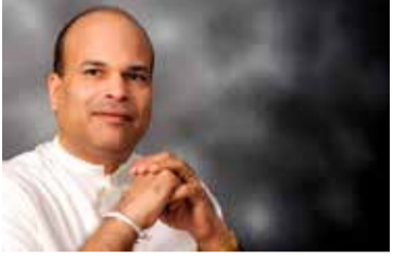
சீக்கிய செயல்பாட்டாளர் கனடாவில் சுட்டுக்கொல்லப் பட்டமையின் பின்னணியில்

புதுடில்லி, செப். 27 இந்தியா - கனடா விவகாரத்தில் இலங்கை இந்தியாவுக்கு ஆதரவளிப்பதாக இந்தியாவுக்கான இலங்கை உயர்ஸ்தானிகர் மிலிந்த மொறகொட தெரிவித்துள்ளார்.