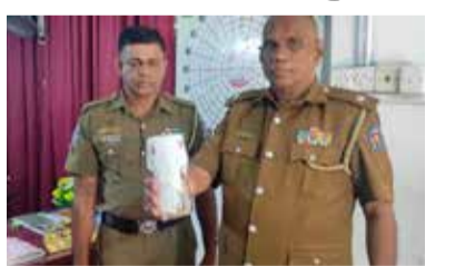
சந்தேகநபரை கைது செய்தனர். (ஐ)

சந்தேகநபரை மட்டக்களப்பு நீதிவான் நீதிமன்றில் முற்படுத்த நடவடிக்கை எடுக்கப்பட்டுள்ளது. (ஐ)