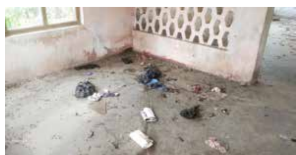
காடு மண்டி காணப்படுகின்றது. இது இவ்வாறான குற்றங்கள் - நடத்தை மீறல்களுக்கு துணையாக உள்ளதாகக் கூறப்படுகின்றது.

மேலும் குறித்த பகுதியில் இயங்கி வருகின்ற காதி நீதிமன்றத்தை சுற்றி காணப்படுகின்ற வீடுகளும் யாவும் கைவிடப்பட்டு சுமார் 19 வருடங்களாக