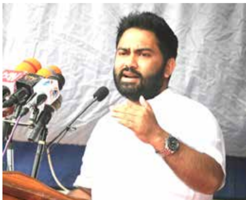
தமது வாழ்வாதாரத்தை முன்னெடுத்துச் செல்கின்றனர்.

இதில் சட்டரீதியாக அனுமதிப்பதிரம் வழங்கப்பட்ட சுருக்கு வலை மூலம் கிண்ணியா, மூதூர், திருகோணமலை, நிலாவெளி, இறக்கக்கண்டி, குச்சுவெளி, புடவைக்கட்டு, புல்மோட்டை, வெருகல் போன்ற பிரதேசங்களைச் சேர்ந்த 5000 க்கு மேற்பட்ட மீனவர்க்கும் அனுமதி வழங்கப்படும்.