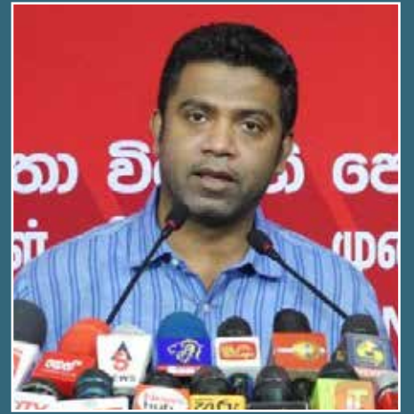
னைகளுக்கு அடிபணிந்து செயற்பட நேரிட்டுள்ளது என்றும் அவர் சுட்டிக்காட்டியுள்ளார்.

இதேவேளை அரசு உரிய நேரத்தில் உதவி பெற்றுக் கொள்ள தவறியதனால் சர்வதேச நாணய நிதியத்தின் நிபந்த