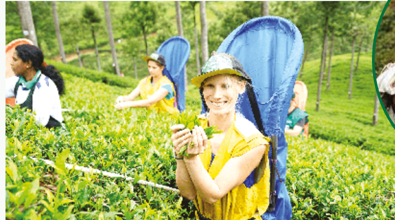
வெளிநாட்டவர்களின் ஒரு நேரக் கூத்து அல்ல இவர்களது வாழ்க்கை...

இப்படித் திரட்டப்பட்ட தொழிலாளர் கோஷடி இந்த காங்காணியின் முழுக்கட்டுப்பாட்டில் இருந்தது. தலைமைக் காங்காணி அல்லது பெரிய காங்காணி சில சில லறைக் காங்காணிகளை இப்பணியில் தனது