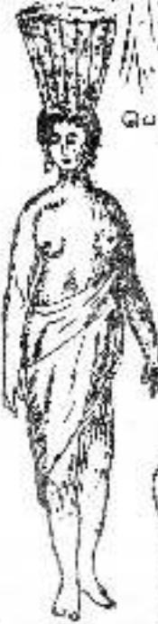
19ம் நூற்றாண்டில் பொன்னுலைய காளியம்மா