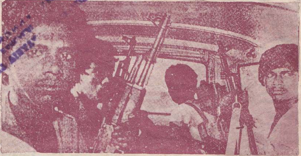
Tamil guerrilla fighters display AK-47 rifles while returning to their camp near Jaffna after a battle with government troops. They have been called upon to stop moving materials from India in response to Sri Lanka's bombing halt.

A Sri Lankan official said: "If the cessation takes place the bombing halt will continue for another week and soon the aim will be to generate a full ceasefire after one month. And then we shall be prepared to talk to any individual or group about a political solution."