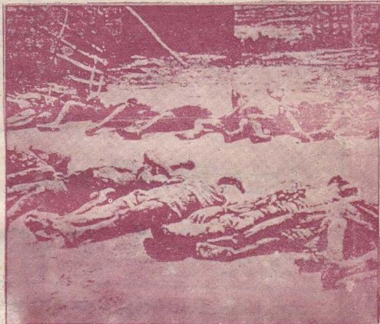
VICTIMS OF CONFLICT: Bodies litter the streets in war-torn Sri Lanka

Rival propaganda machines vie to produce horror stories and appalling photographs to back their conflicting claims. A pro-government newspaper in Colombo claims that Tamil rebels drain every last drop of blood from living captives to replenish their own emergency supplies. From the guerrillas' base camps in southern India, comes a claim