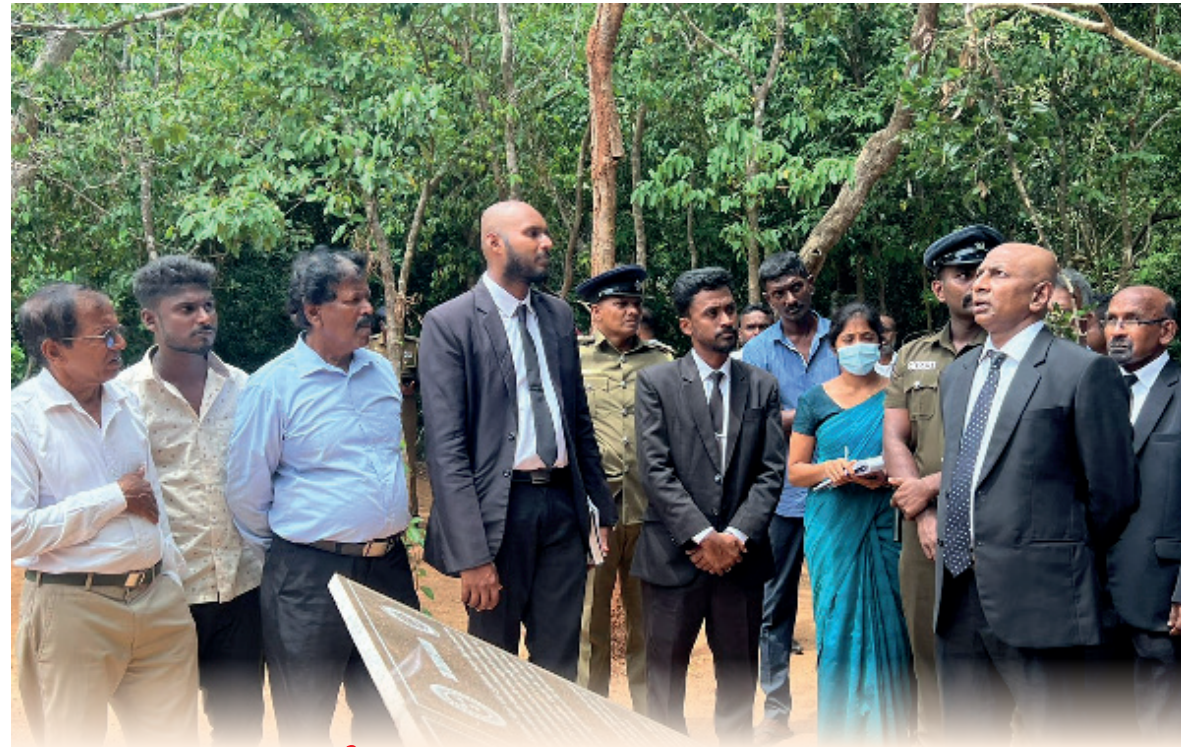
நீதிபதி சரவணராஜா விவகாரம்;