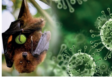
நேர்மறையான அறிக்கையும் இல்லை என்றும் கடந்த 5 ஆண்டுகளில் கோராவைத்

கடந்த ஓகஸ்ட் மாதத்தில் 6 பேருக்கு தொற்று உறுதி செய்யப்பட்டு அதில் இருவர் உயிரிழந்துள்ள நிலையில், பாதிக்கப்பட்ட நோயாளிகளின் சாத்தியமான தொடர்புகள் என்று சந்தேகிக்கப்படும் 700 க்கும் மேற்பட்ட நபர்கள் தனிமைப்படுத்தப்பட்டுள்ளனர். நோய்த்தொற்றுக்காக அவர்கள் பரிசோதிக்கப்பட்ட போது, செப்டம்பர் 22 வரை எந்த