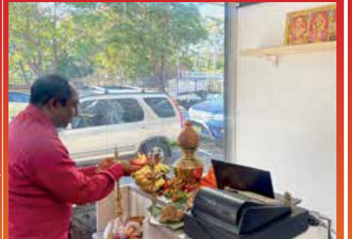
சிட்னியில் கடை திறப்பும் பூசை (குளிர்காலம்)