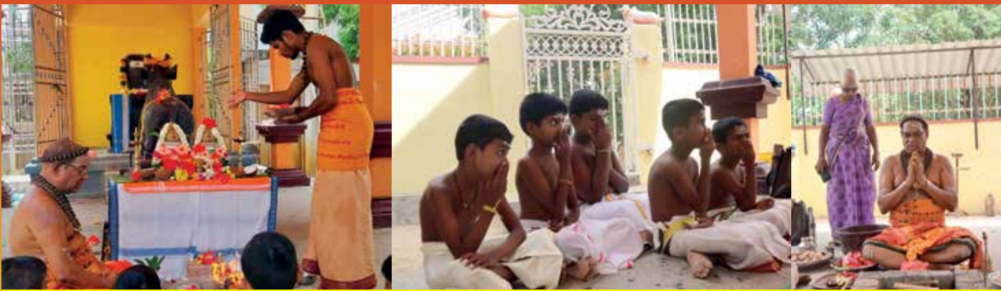
கொக்குவில் இந்து ஆரம்பப் பாடசாலையில் நுழைவு தீக்கை (சமய தீக்கை) வழங்கல் (30-08-2023)