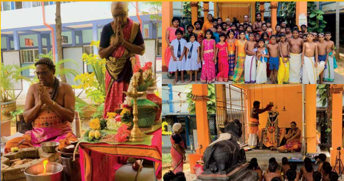
யாழ்ப்பாணம் இந்து ஆரம்பப் பாடசாலையில் நுழைவு தீக்கை (சமய தீக்கை) வழங்கல் (29-08-2023)