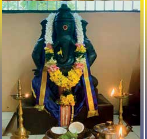
தென்னாட்டில் விநாயகர் சதுர்த்தி சிறப்பு வழிபாடுகள் (18-09-2023)