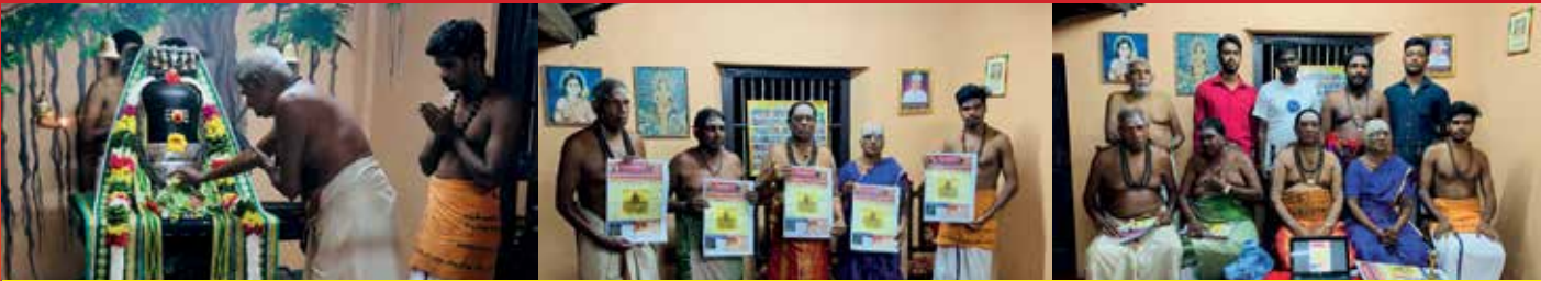
ஆவணித் திங்கள் நிறைமதி வழிபாடும் இதழ் வெளியீடும் (30-08-2023)