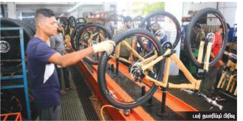
புர தயாரிப்பு பிரிவு

வசதியை வழங்கக் கூடியவாறு மின்சார சைக்கிள்கள் தயாரிக்கப்பட்டுள்ளன. தற்போது காணப்படும் நிதிப்பிரச்சினையின் மத்தியில் பயனுள்ள மாற்றுத் திட்டமாக இதனை பயன்படுத்த முடியும் எனவும் அவர் தெரிவித்தார்.