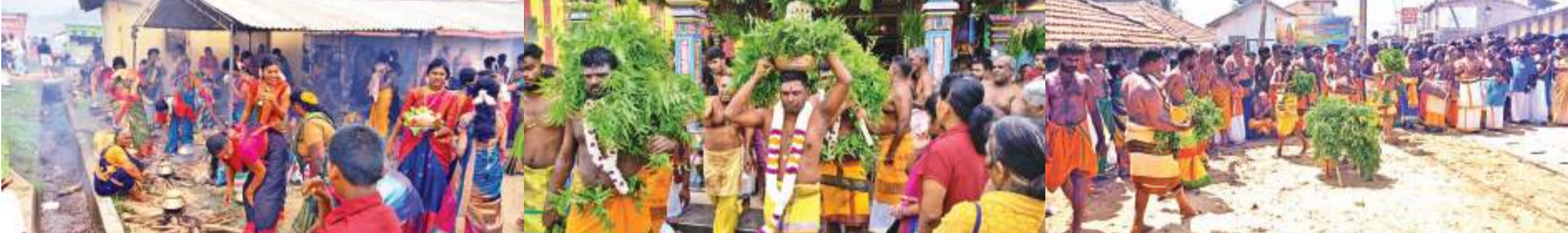
வரலாற்று சிறப்பு வாய்ந்த உடப்பு லீல வீரபத்திர காளியம்மன் ஆலயத்தின் வருடாந்த "வேள்விப் பொங்கல்" உற்சவம் வெள்ளிக்கிழமை (6) மிகவும் சிறப்பாக நடைபெற்றது. பத்து நாட்கள் கும்பம் பாலித்தல் நடைபெற்று பூஜைகள் இடம்பெற்றதுடன், பொங்கலில் பலர் கலந்துகொண்டனர். பின்னர் கடல் அன்னைக்கு அபிஷேகம் நடைபெற்றதுடன், கச்சான் காற்று நிறைவடையும் தருவாயில் வாடைக்காற்று ஆரம்பமாகும். இதன் பிற்பாடு கரைவலை மீனவர்கள் தமது தொழிலை தொடங்கி ஆரம்பிப்பார்கள். பல மீன்பிடி வளங்களைத் தொழிலுக்காக தயாரித்தப்பட்ட நிலையில் காணப்பட்டன. (உடப்பு குறும்பு நிருபர்)