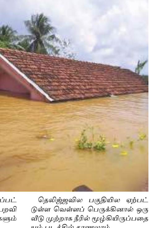
தெல்லிஜ்ஜுவில பகுதியில் ஏற்பட்டுள்ள வெள்ளப் பெருக்கினால் ஒரு விடு முற்றாக நீரில் மூழ்கியிருப்பதையும் படத்தில் காணலாம்.

வெலிகம தினகரன் நிருபர் மாத்தறை மற்றும் காலி மாவட்டங்களில் நிலவி வரும் சீரற்ற காலநிலையால் குறிப்பிட்ட இரு மாவட்டங்களிலுமுள்ள சகல பாடசாலைகளுக்கும் இன்று 9ம் திகதி திங்கட்கிழமைமையும், நாளை 10ம் திகதி செவ்வாய்க்கிழமைமையும் விடுமுறை வழங்கப்பட்டுள்ளன. மாத்தறை மாவட்டப் பாடசாலைகள் கடந்த 5ஆம், 6ஆம் திகதிகளிலும் மூடப்பட்டிருந்தது. தென் மாகாண ஆளுநர் கலாநிதி விலி கமகே தலைமையில் தென் மாகாண அனர்த்த முகாமத்துவ அதி காரிகள், மற்றும் கல்வி அதி காரிகளுடன் மேற்கொண்ட கலந்துரையாடலின் போதே இத் தீர்மானம் மேற்கொள்ளப்பட்டுள்ளது. இவ்வாரம் நடைபெறவிருந்த 2ம் தவணைப் பரீட்சைகளும் பிற்போடப்பட்டுள்ளன.