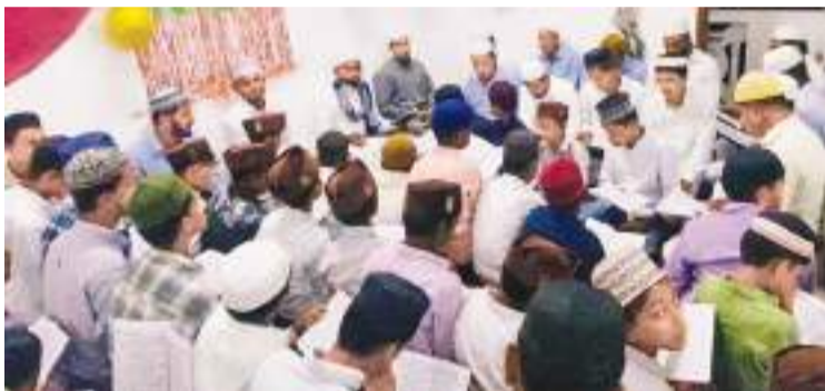
பேருவளை சீனக்கோட்டை பாளியியத்துஷ் ஷாதுலிய்யா அமைப்பின் ஏற்பாட்டில் சீனக்கோட்டையில் மௌவினாள் நபி தமாம் மஜ்லிஸ் வெகு சிறப்பாக நடைபெற்று முடிந்தது. இந்நிகழ்வில் உலமாக்கள் உட்பட இறைவர்கள் கலந்து சிறப்பித்ததை படத்தில் காணலாம். (படம்: பேருவளை குறாப் நிருபர்)

வத்தில் உயிரிழந்தவர் 35 க்கும் 45 வயதுக்கும் இடைப்பட்ட வயதுடையவர் என்பது தெரியவந்துள்ளது என்பதிலும் இதுவரையில் இவர் அடையாளம் காணப்பட்டவில்லை. விபத்து இடம்பெற்றுள்ள இடத்தில் உயிரிழந்தவருடையது என சந்தேகிக்கப்படும் துவிச்சக்கரவண்டி டிரைவரும் கண்டெடுக்கப்பட்டுள்ளது. மேலதிக விசாரணைகளை மதவாச்சி பொலிஸ் நிலைய போக்குவரத்து பொலிஸார் மேற்கொண்டு வருகின்றனர்.