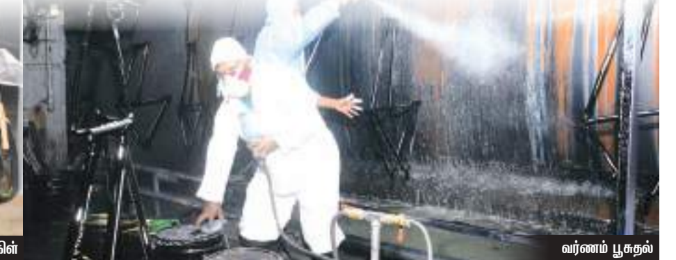
லுமாலா சைக்கிள் வர்ணம் பூசுதல்