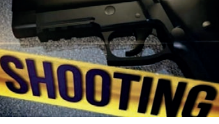
காயமடைந்த சந்தேகநபர் பலபிட்டிய வைத்தியசாலையில் அனுமதிக்கப்பட்டதையடுத்து உயிரிழந்துள்ளார். தெற்கில் இடம்பெற்ற பல குற்றங்களுடன், இவர் தொடர்புடைய சந்தேகநபர்களில் இவரும் ஒருவர் என பொலிஸார் தெரிவித்துள்ளனர். இந்த சம்பவம் தொடர்பான மேலதிக விசாரணைகளை பொலிஸார் ஆரம்பித்துள்ளனர்.

மீட்டியாகொட - தெல்வத்த பகுதியில் பொலிஸ் விசேட அதிரடிப் படையினருடன் இடம்பெற்ற பரஸ்பரத் துப்பாக்கி பிரயோகங்களில் ஒருவர் உயிரிழந்துள்ளார். பாடாள உலக குழு உறுப்பினர் என சந்தேகிக்கப்படும் ஒருவர் வீடொன்றில் மறைந்திருப்பதாகக் கிடைக்கப்பெற்ற தகவலையடுத்து, விசேட அதிரடிப் படையினர் குறித்த வீட்டைச் சுற்றி வளைத்துள்ளனர். இதன்போது, சந்தேகநபர் விசேட அதிரடிப் படையினரை நோக்கி துப்பாக்கி பிரயோகம் நடாத்தியுள்ளதாக பொலிஸார் தெரிவித்துள்ளனர். இதையடுத்து, விசேட அதிரடிப் படையினர் நடத்திய பதில் துப்பாக்கி பிரயோகத்தில் குறித்த சந்தேகநபர் காயமடைந்துள்ளார்.