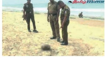
பொலிஸார் விசாரணைகளை முன்னெடுக்கின்றனர். குறித்த தலை தொடர்பில் நீதவான் விசாரணை நடத்தப்படவுள்ளதுடன், பழைய பொலிஸார் மேலதிக விசாரணைகளை மேற்கொண்டு வருகின்றனர்.

துண்டிக்கப்பட்ட மனித தலை ஒன்று பழைய காலம் அம்பலம் கடற்கரையில் மீட்கப்பட்டுள்ளது. பழைய பொலிஸாருக்கு கிடைத்த தகவலின் படி இந்த மனித தலை வியாழக்கிழமை (12) மீட்கப்பட்டுள்ளது. இவ்வாறு மீட்கப்பட்ட தலை, யாருடையதென அடையாளம் காண முடியாத அளவிற்கு சிதைந்துள்ளதாக பொலிஸார் தெரிவிக்கின்றனர். அத்துடன் தலைக்கு உரிய ஏனைய உடற்பாகங்கள் தொடர்பிலும்