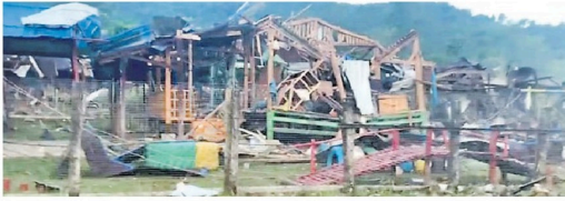
இந்நிலையில், இராணுவத்துக்குப் பயந்து விடுகின்ற இடம், இடம்பெயர்ந்த பொதுமக்கள் மியன்மாரின் லைசா நகருக்கு அருகில் முல்லை வளைவுப் பகுதியிலுள்ள கூடாரத்தில் தங்கியிருந்தனர். கடந்த திங்கட்கிழமை இரவு 11 மணிப்பயளவில் திடீரென அங்கு வந்த இராணுவ ஜெட்-விமானம் கூடாரத்தின் மீது குண்டு வீசியது. அதில் கூடாரத்தில் தங்கியிருந்த 13 குழந்தைகள் உட்பட 19 பேர் பரிதாபமாகப் பலியானனர்.

இராணுவத்துக்கு எதிராக ஜனநாயக மக்கள் பல... என்ற ஆயத்தநேரம் குழுவும் கச்சின் முல்லை வளைவுப் பகுதியிலுள்ள கூடாரத்தில் ஈடுபட்டு வருகின்றனர்.