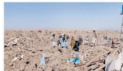
ஆப்கானிஸ்தானில் நேற்றுக் காலை மீண்டும் சக்திவாய்ந்த நிலநடுக்கம் ஏற்பட்டது.

6.1 ரிசுட் அளவு பதிவாகியுள்ளதாக தேசிய நில ஆய்வு மையம் (என்சிஸ்) தெரிவித்துள்ளது.